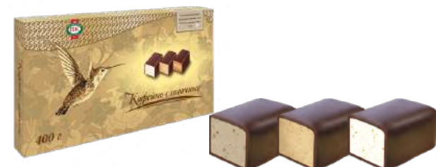
КОНФЕТЫ «КОФЕЙНО-СЛИВОЧНЫЕ» 1/400 CANDIES "CLASSICAL COFFEE AND CREAMY" 1/400 "海滨咖啡奶油味" 糖 "KLASSICHESKIE 咖啡奶油味" 1/400

Упаковка: фрасованная - 1/270, 10 шт в г/к Filled packaging 1/270, 10 pcs in a corrugated box 分包包装: 1/270 · 每个瓦楞纸箱10个