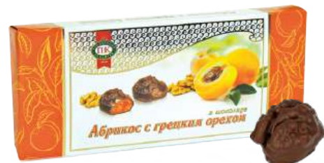
КОНФЕТЫ «АБРИКОС С ГРЕЦКИМ ОРЕХОМ В ШОКОЛАДЕ» 1/150 CANDIES "APRICOT WITH WALNUT, COVERED WITH CHOCOLATE" 1/150 杏仁核桃糖果 1/150

Корпус - абрикос с грецким орехом, в шоколадной глазури Case of apricot with walnut, in chocolate coating 夹心糖馅: 杏子与核桃 · 在巧克力淋面里