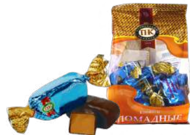
КОНФЕТЫ «ВАСИЛЬКОВАЯ ТАЙНА» В/П CANDIES "CORNFLOWER MYSTERY" W/T 夹心糖 "矢车菊之谜" W/T

Конфеты с помадным крем-брюле корпусом с добавлением сливочного масла и коньяка