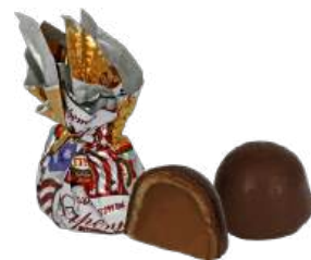
КОНФЕТЫ «ДАРЁНКА МОЛОЧНАЯ» В/П CANDIES "DARYONKA MILK" W/T 夹心糖 "送礼母牛" W/T

包装: 分包包装-1/200 · 每个瓦楞纸16个 · 论个的商品 - 0.6公斤 · 6个在g/k