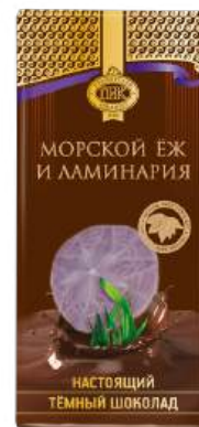
ШОКОЛАД ТЁМНЫЙ «ПРИМОРСКИЙ КОНДИТЕР» С ЛАМИНАРИЕЙ И МОРСКИМ ЕЖОМ DARK CHOCOLATE "PRIMORSKY KONDITER" WITH KELP AND SEA URCHIN 黑巧克力海带海胆

Срок хранения: 6 месяцев Storage time: 6 months 保存期: 6个月