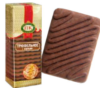
ПЕЧЕНЬЕ «ТРЮФЕЛЬНОЕ С КОРИЦЕЙ» COOKIES "TRUFFLE WITH CINNAMON" 饼干 "肉桂松露"

Упаковка: фрасованная - 1/300, 20 шт в г/к Filled packaging: 1/300, 20 pcs in a corrugated box 分包包装: 1/300, 每个瓦楞纸箱20个