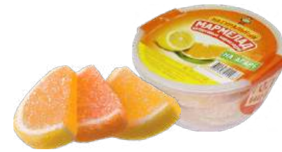
МАРМЕЛАД «ЦИТРУСОВЫЕ МАРМЕЛАДКИ» 1/300 MARMALADE "CITRUS MARMELADES" 1/300 柑橘果酱1/300

Мармелад на основе агара. Набор двух сортов различной окраски и аромата (апельсина и лимона). Форма в виде долек, обсыпанных сахаром