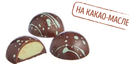
ШОКОЛАДНЫЕ КОНФЕТЫ С НАЧИНКОЙ «ФИСТАШКИ» CHOCOLATE CANDIES WITH FILLING "PISTACHIO" "开心果" 馅料巧克力糖

Упаковка: весовая - 3 кг в г/к Weight packaging: 3 kg in a corrugated box 重量包装: 每个瓦楞纸箱3公斤