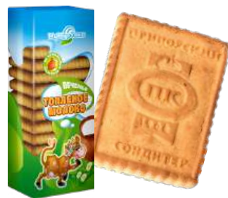
ПЕЧЕНЬЕ «МУМУРЁНКА» ТОПЛЁНОЕ МОЛОКО COOKIES "MUMURENKA" BAKED MILK "MUMURENKA"饼干 - 文火煮开的牛奶

Сахарное печенье с добавлением натурального топлёного молока Sugar cookies with natural baked milk 含天然文火煮开牛奶的糖饼干