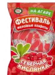
КОНФЕТЫ ЖЕЛЕЙНЫЕ НЕГЛАЗИРОВАННЫЕ «ФЕСТИВАЛЬ СО ВКУСОМ КИСЛЯНКИ» 1/250 UNGLAZED JELLY CANDIES "FESTIVAL WITH WITH SOUR TASTE" 1/250 無釉果冻糖果 "节日 带有酸味" 1/250

Упаковка: фрасованная - 1/250, 18 шт в г/к, весовая - 1 кг, 6 шт в г/к Package: filled packaging - 1/250, 18 pcs in a corrugated box, weight - 1 kg, 6 pcs in a corrugated box 包装: 分包包装-1/250 · 每个瓦楞纸18个, 重量-分包包装-1公斤 · 每个瓦楞纸6个