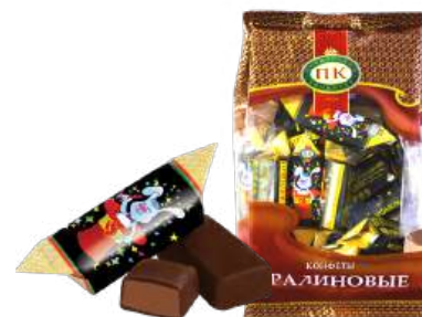
КОНФЕТЫ «ПРАЛИНОВЫЕ» В/Н CANDIES «PRALINE» S 夹心糖 "果仁糖" S

Конфеты с пралиновым корпусом с добавлением карамельной массы Candies of a praline, with caramel mass