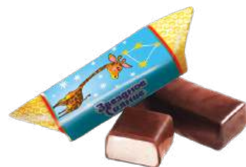
КОНФЕТЫ «ЗВЕЗДНОЕ СИЯНИЕ С ВАНИЛЬНО-СЛИВОЧНЫМ ВКУСОМ» В/Н CANDIES «STARLIGHT WITH VANILLA AND CREAMY FLAVOUR» S 夹心糖 香草奶油味 “星光” 馅 S

Конфеты с корпусом типа пралине с добавлением жареного тёртого ядра фундука Candies of a praline type center, with fried grounded hazelnut kernel 含炸磨碎榛子·胡桃糖馅的夹心糖