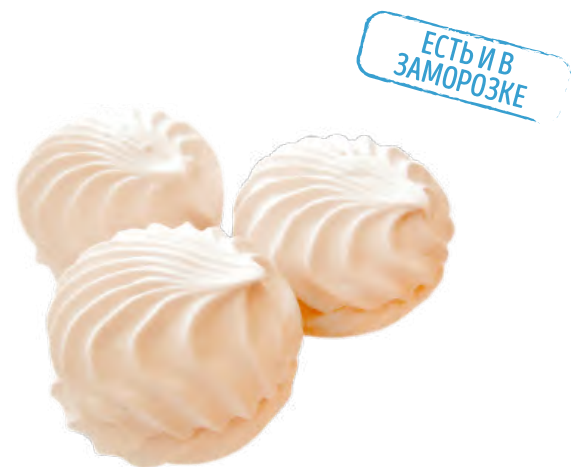
ЗЕФИР НЕГЛАЗИРОВАННЫЙ «СО ВКУСОМ КАПУЧИНО» ZEPHYR "WITH CAPPUCCINO FLAVOUR" 卡布奇诺口味棉花糖

Упаковка: весовая - 2 кг в г/к (в г/к входит 2 упаковки «телевизор» по 1 кг) Weight packaging: 2 kg in a corrugated box (corrugated box includes 2 "TV" packs, 1 kg each) 重量包装: 每个瓦楞纸箱2公斤 (每个瓦楞纸箱包括2个“电视机”包装, 每个重量为1公斤)