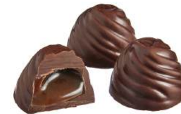
ШОКОЛАДНЫЕ КОНФЕТЫ ЛИКЁРНЫЕ «КОФЕЙНЫЕ» Н/З CHOCOLATE CANDIES WITH LIQUEUR "COFFEE" N/W 力娇酒的巧克力糖 "咖啡" N/W

Упаковка: весовая - 2,8 кг в г/к Weight packaging: 2,8 kg in a corrugated box 重量包装: 每个瓦楞纸箱2,8公斤