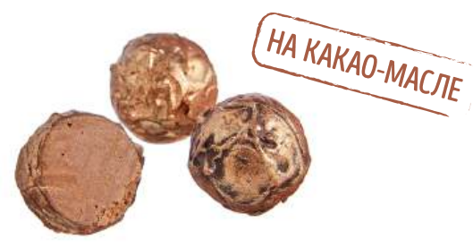
КОНФЕТЫ «ТРЮФЕЛЬ С ЛИКЁРОМ БЕЙЛИС» CANDIES "TRUFFLE WITH BAILEYS LIQUEUR" 夹心糖 "松露配百利甜酒"

Упаковка: весовая « телевизор » – 1,3 кг в г/к Weight packaging: "TV" - 1,3 kg in a corrugated box 重量包装: "电视机" -每个瓦楞纸箱1,3公斤