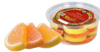
МАРМЕЛАД «ЦИТРУСОВЫЕ МАРМЕЛАДКИ» 1/400 MARMALADE "CITRUS MARMELADES" 1/400 柑橘果酱1/400

Упаковка: фрасованная - 1/200, 15 шт в г/к Filled packaging 1/200, 15 pcs in a corrugated box 分包包装: 1/200 · 每个瓦楞纸箱15个