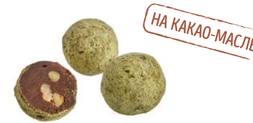
КОНФЕТЫ «ТРЮФЕЛЬ С КЕДРОВЫМ ОРЕХОМ И ФИСТАШКОЙ» CANDIES "TRUFFLE WITH PINE NUTS AND PISTACHIO" 夹心糖 "松露配松子和开心果"

Упаковка: весовая « телевизор » – 1,3 кг в г/к Weight packaging: "TV" - 1,3 kg in a corrugated box 重量包装: "电视机" -每个瓦楞纸箱1,3公斤