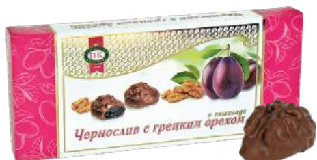
КОНФЕТЫ «ЧЕРНОСЛИВ С ГРЕЦКИМ ОРЕХОМ В ШОКОЛАДЕ» 1/150 CANDIES "PRUNE WITH WALNUT, COVERED WITH CHOCOLATE" 1/150 夹心糖 "巧克力核桃和李子" 1/150

Упаковка: фрасованная - 1/150, 10 шт в г/к Filled packaging 1/150, 10 pcs in a corrugated box 分包包装: 1/150 · 每个瓦楞纸箱10个