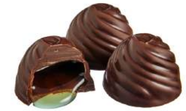
ШОКОЛАДНЫЕ КОНФЕТЫ ЛИКЁРНЫЕ «СО ВКУСОМ АМАРЕТТО» Н/З CHOCOLATE CANDIES WITH LIQUEUR "WITH AMARETTO FLAVOUR" N/W 力娇酒的巧克力糖 "杏仁味" N/W

Упаковка: весовая - 2,4 кг в г/к Weight packaging: 2,4 kg in a corrugated box 重量包装: 每个瓦楞纸箱2,4公斤