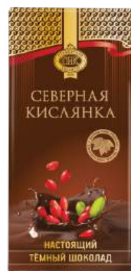
ШОКОЛАД ТЁМНЫЙ «СЕВЕРНАЯ КИСЛЯНКА» С БАРБАРИСОМ DARK CHOCOLATE "PRIMORSKY KONDITER" WITH BARBERRIES 黑巧克力 "PRIMORSKIJ KONDITER" 含伏牛花子

Срок хранения: 6 месяцев Storage time: 6 months 保存期: 6个月