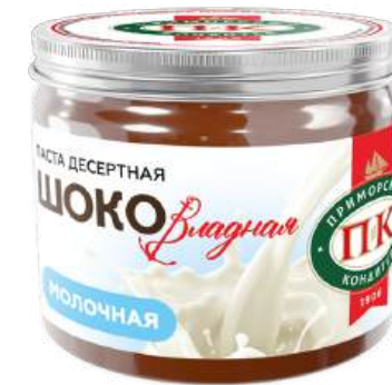
ПАСТА ДЕСЕРТНАЯ МОЛОЧНАЯ «ШОКОВЛАДНАЯ» 1/200 MILKY DESSERT PASTE "SHOKOVLADNAYA" 1/200 “可口符拉迪” 甜点奶糊1/200

Срок хранения: 6 месяцев Storage time: 6 months 保存期: 6个月