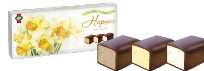
НАБОР КОНФЕТ «НАРЦИСС» 1/280 CANDY SET "NARCISSUS" 1/280 夹心糖 "水仙花" 1/280

Упаковка: фасованная - 1/220, 8 шт в г/к Filled packaging 1/220, 8 pcs in a corrugated box 分包包装: 1/220 · 每个瓦楞纸箱8个