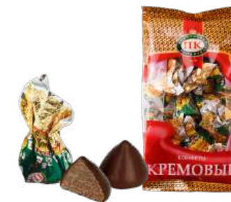
КОНФЕТЫ «МЕГАФИШКА» В/П CANDIES "MEGAFISHKA" W/T 夹心糖 "先锋营火" W/T

Конфеты глазированные кондитерской глазурью с шоколадно-кремовым корпусом и добавлением сухого молока