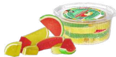
МАРМЕЛАД «АРБУЗНЫЕ И ДЫННЫЕ МАРМЕЛАДКИ» СО ВКУСОМ АРБУЗА И ДЫНИ MARMALADE "WATERMELON AND MELON MARMELADES WITH WATERMELON AND MELON FLAVOUR" 果酱“西瓜和甜瓜果酱”带有西瓜和甜瓜的味道

Упаковка: фрасованная - 1/300, 15 шт в г/к Filled packaging 1/300, 15 pcs in a corrugated box 分包包装: 1/300 · 每个瓦楞纸箱15个