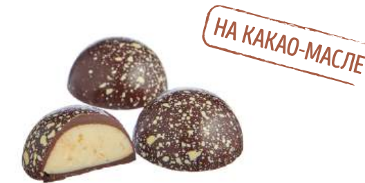
ШОКОЛАДНЫЕ КОНФЕТЫ С НАЧИНКОЙ «ЛИМОН» CHOCOLATE CANDIES WITH FILLING "LEMON" "柠檬" 馅料巧克力糖

Упаковка: весовая - 2,4 кг в г/к Weight packaging: 2,4 kg in a corrugated box 重量包装: 每个瓦楞纸箱2,4公斤