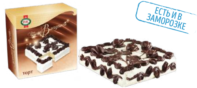
ТОРТ ВАФЕЛЬНЫЙ «ШИКОВЛАДНЫЙ» WAFFLE CAKE "SHIKOVVLADNY" 华夫饼 "ShikoVladny"

Упаковка: ориентировочный вес тортов - 650 г; 1000 г; 2000 г Package: approximate weight of cakes - 650 g; 1000 g; 2000 g 包装: 大蛋糕的大约重量: 650克; 1000克; 2000克