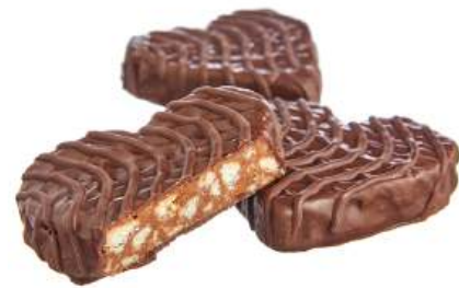
КОНФЕТЫ «СЛАДКОЕ СЕРДЕЧКО» Н/З CANDIES "SWEET HEART" N/W 夹心糖 "心" N/W

Конфеты в форме сердечка глазированные и декорированные тёмной глазурью. Корпус состоит из сбивной массы с добавлением крошки печенья