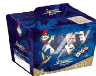
КОНФЕТЫ «ПРИМОРСКИЕ АССОРТИ» (ЗАМОРОЗКА) 1/300 CANDIES "PRIMORSKIE ASSORTI" (FREEZE) 1/300 夹心糖 "PRIMORSKIE 什锦" (冻结) 1/400

Упаковка: фрасованная - 1/270, 10 шт в г/к Filled packaging 1/270, 10 pcs in a corrugated box 分包包装: 1/270 · 每个瓦楞纸箱10个