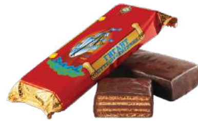
КОНФЕТЫ ВАФЕЛЬНЫЕ «ГИГАНТ-ПУТЕШЕСТВЕННИК» Т WAFFLE CANDIES "GIANT TRAVELER" S/W 窝夫夹心糖 "巨人旅行者" S/W

Вафельные конфеты с начинкой на основе сахарной пудры, жареного тёртого арахиса с добавлением какао тёртого и ванилина