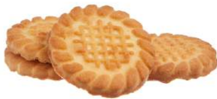
ПЕЧЕНЬЕ «КЛАССИЧЕСКОЕ» COOKIES "CLASSICAL" 饼干 "经典"

Сахарное печенье с добавлением мёда Sugar biscuits with addition of honey 蜂蜜糖饼