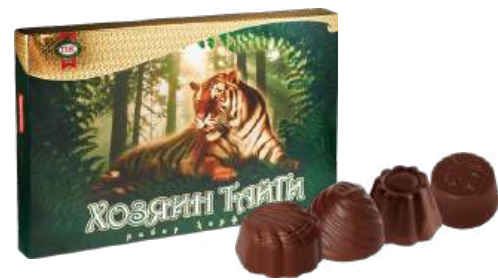
НАБОР КОНФЕТ «ХОЗЯИН ТАЙГИ» 1/205 CANDY SET "MASTER OF THE TAIGA" 1/205 “针叶林的主人” 糖 1/205

Упаковка: фасованная - 1/190, 5 шт в г/к Filled packaging 1/190, 5 pcs in a corrugated box 分包包装: 1/190 · 每个瓦楞纸箱5个