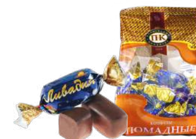
КОНФЕТЫ «ЛИВАДИЯ» В/П CANDIES "LIVADIA" W/T 夹心糖 "利瓦迪亚湾" W/T

Конфеты с помадным корпусом с добавлением какао-порошка, яблочного пюре и миндального ароматизатора