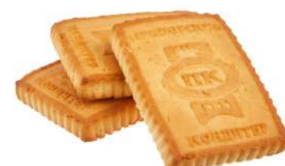
ПЕЧЕНЬЕ «ТОПЛЁНОЕ МОЛОКО» COOKIES "BAKED MILK" 饼干 "融化的牛奶"

重量包装: 每个瓦楞纸箱3,2公斤 (每个瓦楞纸箱包括2个“电视机”包装·每个重量为1,6 公斤)