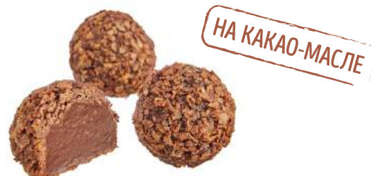
КОНФЕТЫ «ТРЮФЕЛЬ СОЛЁНАЯ КАРАМЕЛЬ» CANDIES "TRUFFLE SALTED CARAMEL" 夹心糖 "松露盐焦糖"

Упаковка: весовая « телевизор » – 1,3 кг в г/к Weight packaging: "TV" - 1,3 kg in a corrugated box 重量包装: "电视机" -每个瓦楞纸箱1,3公斤