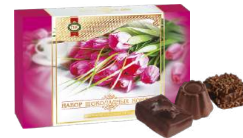
НАБОР КОНФЕТ «НАБОР ШОКОЛАДНЫХ КОНФЕТ» 1/270 CANDY SET "A SET OF CHOCOLATE CANDIES" 1/270 巧克力套装 1/270

Упаковка: фрасованная - 1/200, 5 шт в г/к Filled packaging 1/200, 5 pcs in a corrugated box 分包包装: 1/200 · 每个瓦楞纸箱5个