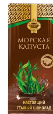
ШОКОЛАД ТЁМНЫЙ «ПРИМОРСКИЙ КОНДИТЕР» С МОРСКОЙ КАПУСТОЙ DARK CHOCOLATE "PRIMORSKY KONDITER" WITH SEAWEED 海藻黑巧克力

Срок хранения: 9 месяцев Storage time: 9 months 保存期: 9个月