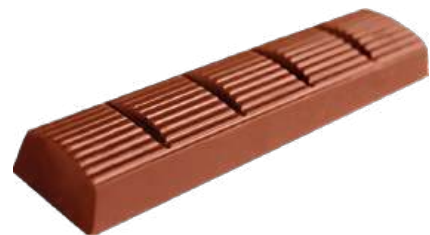
ШОКОЛАД МОЛОЧНЫЙ «ПРИМОРСКИЙ КОНДИТЕР» MILK CHOCOLATE "PRIMORSKY KONDITER" 牛奶巧克力

Срок хранения: 10 месяцев Storage time: 10 months 保存期: 10个月