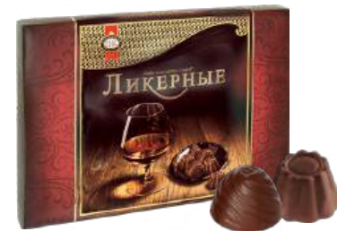
НАБОР КОНФЕТ «ЛИКЁРНЫЕ» 1/190 CANDY SET "LIQUEUR" 1/190 利口酒糖果 1/190

Упаковка: фасованная - 1/195, 5 шт в г/к Filled packaging 1/195, 5 pcs in a corrugated box 分包包装: 1/195 · 每个瓦楞纸箱5个