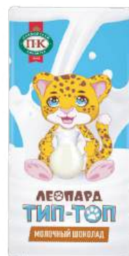
ШОКОЛАД МОЛОЧНЫЙ «ЛЕОПАРД ТИП-ТОП» MILK CHOCOLATE "LEOPARD TIP-TOP" "豹 Tip-Top" 牛奶巧克力

Срок хранения: 6 месяцев Storage time: 6 months 保存期: 6个月