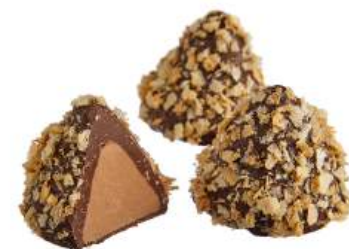
КОНФЕТЫ «ЗОЛОТЫЕ ДАЛИ» Н/З CANDIES "GOLDEN DISTANCES" N/W