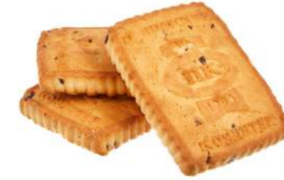
ПЕЧЕНЬЕ «КЛЮКВЕННОЕ» COOKIES "CLASSICAL WITH CRANBERRY" 饼干 "蔓越莓"

Упаковка: весовая – 5 кг в г/к Weight packaging: 5 kg in a corrugated box 重量包装: 每个瓦楞纸箱5公斤