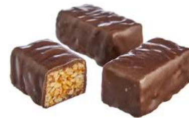
КОНФЕТЫ ГРИЛЯЖНЫЕ «КОМЕТА» Н/З CANDIES WITH CANDIED ROASTED NUTS "COMET" N/W 坚果糖 "彗星" N/W

Упаковка: весовая - 4 кг в г/к Weight packaging: 4 kg in a corrugated box 重量包装: 每个瓦楞纸箱4公斤