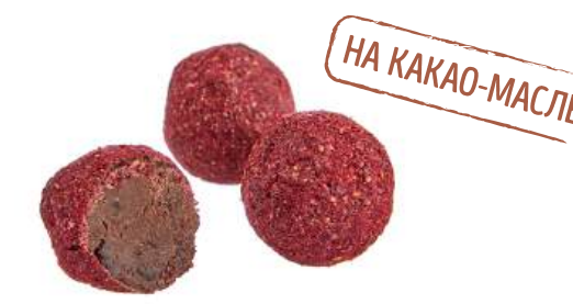
КОНФЕТЫ «ТРЮФЕЛЬ С ВИШНЕЙ И МАЛИНОЙ» CANDIES "TRUFFLE WITH CHERRIES AND RASPBERRIES" 夹心糖 "松露配樱桃和覆盆子糖"

Упаковка: весовая « телевизор » – 1,3 кг в г/к Weight packaging: "TV" - 1,3 kg in a corrugated box 重量包装: "电视机" -每个瓦楞纸箱1,3公斤