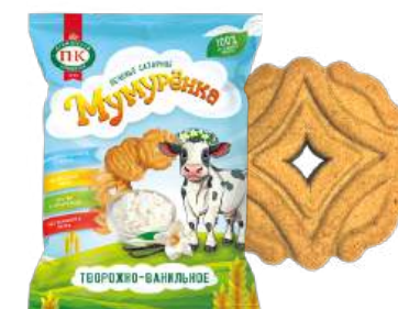
ПЕЧЕНЬЕ САХАРНОЕ«МУМУРЕНКА» ТВОРОЖНО-ВАНИЛЬНОЕ SUGAR COOKIES "MUMURENKA" CURD AND VANILLA 糖饼干 "MUMURENKA" 凝乳和香草

Упаковка: фрасованная - 1/180, 10 шт в г/к Filled packaging: 1/180, 10 pcs in a corrugated box 分包包装: 1/180, 每个瓦楞纸箱10个