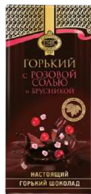
ШОКОЛАД ГОРЬКИЙ «ПРИМОРСКИЙ КОНДИТЕР» С БРУСНИКОЙ И ГИМАЛАЙСКОЙ РОЗОВОЙ СОЛЬЮ BITTER CHOCOLATE 75% COCAO "PRIMORSKY KONDITER" WITH LINGONBERRIES AND HIMALAYAN PINK SALT 苦味巧克力含越橘和喜馬拉雅粉紅鹽

Срок хранения: 6 месяцев Storage time: 6 months 保存期: 6个月