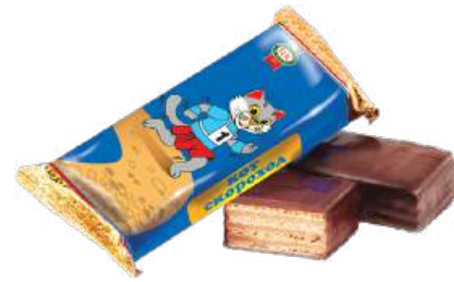
КОНФЕТЫ ВАФЕЛЬНЫЕ «КОТ СКОРОХОД» Т WAFFLE CANDIES "THE CAT IS A RUNNER" S/W 窝夫夹心糖 "腿快的猫" S/W

Вафельные конфеты с начинкой на основе сахарной пудры, жареного тёртого арахиса и ванилина