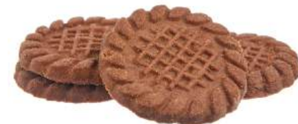
ПЕЧЕНЬЕ «КЛАССИЧЕСКОЕ ШОКОЛАДНОЕ» COOKIES "CLASSICAL CHOCOLATE" 饼干 "巧克力经典"

Упаковка: весовая - 4 кг в г/к Weight packaging: 4 kg in a corrugated box 重量包装: 每个瓦楞纸箱4公斤