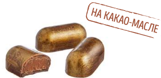
ШОКОЛАДНЫЕ КОНФЕТЫ С НАЧИНКОЙ «КОФЕЙНО-КАРАМЕЛЬНЫЕ» CHOCOLATE CANDIES WITH FILLING "COFFEE AND CARAMEL" "咖啡焦糖" 馅料巧克力糖

重量包装: 每个瓦楞纸箱7公斤 (每个瓦楞纸箱包括2个“电视机”包装·每个重量为3,5公斤)