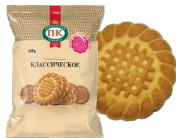
ПЕЧЕНЬЕ «КЛАССИЧЕСКОЕ» COOKIES "CLASSICAL" 饼干 "经典"

Упаковка: фрасованная - 1/400, 8 шт в г/к Filled packaging: 1/400, 8 pcs in a corrugated box 分包包装: 1/400, 每个瓦楞纸箱8个