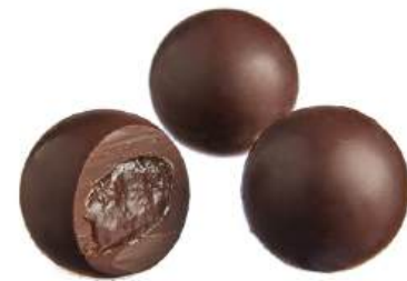
ШОКОЛАДНЫЕ КОНФЕТЫ С НАЧИНКОЙ «ТРЮФЕЛЬНЫЕ» Н/З CHOCOLATE CANDIES WITH FILLING "TRUFFLE" N/W 馅的巧克力夹心糖 "经典松露糖" N/W

Упаковка: весовая - 5 кг в г/к Weight packaging: 5 kg in a corrugated box 重量包装: 每个瓦楞纸箱5公斤