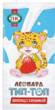
ШОКОЛАД МОЛОЧНЫЙ «ЛЕОПАРД ТИП-ТОП» С КЛУБНИКОЙ MILK CHOCOLATE "LEOPARD TIP-TOP" WITH STRAWBERRY "豹 Tip-Top" 牛奶巧克力 (配草莓)

Срок хранения: 6 месяцев Storage time: 6 months 保存期: 6个月