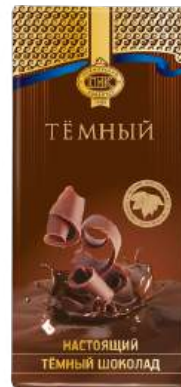
ШОКОЛАД ТЁМНЫЙ «ПРИМОРСКИЙ КОНДИТЕР» DARK CHOCOLATE "PRIMORSKY KONDITER" 黑巧克力

Срок хранения: 12 месяцев Storage time: 12 months 保存期: 12个月