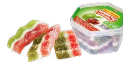
МАРМЕЛАД «ТРЕХСЛОЙНЫЙ» 1/300 MARMALADE "THREE-LAYERED" 1/300 “三层的” 1/300

Упаковка: фрасованная - 1/400, 12 шт в г/к Filled packaging 1/400, 12 pcs in a corrugated box 分包包装: 1/400 · 每个瓦楞纸箱12个