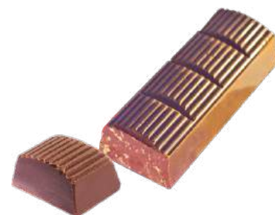
ШОКОЛАД МОЛОЧНЫЙ «ПРИМОРСКИЙ КОНДИТЕР» С ВАФЕЛЬНОЙ КРОШКОЙ MILK CHOCOLATE "PRIMORSKIY KONDITER" WITH WAFFLE CRUMBS 牛奶巧克力 (配威化碎屑)

Упаковка: весовая – 5,4 кг в г/к Weight packaging: 5,4 kg in a corrugated box 重量包装: 每个瓦楞纸箱5,4公斤