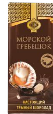
ШОКОЛАД ТЁМНЫЙ «ПРИМОРСКИЙ КОНДИТЕР» С МОРСКИМ ГРЕБЕШКОМ DARK CHOCOLATE "PRIMORSKY KONDITER" WITH SEA SCALLOP 黑巧克力(夹扇贝)

分包包装: 1/100 · 每个展示盒18个 · 每个瓦楞纸箱3个展示盒; 分包包装: 1/65 · 每个展示盒 22个 · 每个瓦楞纸箱4个展示盒