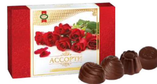
НАБОР КОНФЕТ «АССОРТИ» 1/200 CANDIES "ASSORTI" 1/200 什锦糖 1/200

Упаковка: фрасованная - 1/310, 5 шт в г/к Filled packaging 1/310, 5 pcs in a corrugated box 分包包装: 1/310 · 每个瓦楞纸箱5个