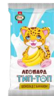
ШОКОЛАД МОЛОЧНЫЙ «ЛЕОПАРД ТИП-ТОП» С БАНАНОМ MILK CHOCOLATE "LEOPARD TIP-TOP" WITH BANANA "豹 Tip-Top" 牛奶巧克力 (配香蕉)

Срок хранения: 6 месяцев Storage time: 6 months 保存期: 6个月