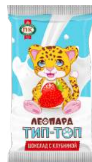
ШОКОЛАД МОЛОЧНЫЙ «ЛЕОПАРД ТИП-ТОП» С КЛУБНИКОЙ MILK CHOCOLATE "LEOPARD TIP-TOP" WITH STRAWBERRIES "豹 Tip-Top" 牛奶巧克力 (配草莓)

Срок хранения: 6 месяцев Storage time: 6 months 保存期: 6个月