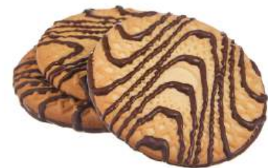
ПЕЧЕНЬЕ «ВАНИЛЬНОЕ ДЕКОРИРОВАННОЕ ТЁМНОЙ ГЛАЗУРЬЮ» COOKIES "VANILLA, DECORATED WITH DARK GLAZE" 饼干 "香草深釉"

Ванильное печенье декорированное тёмной глазурью Vanilla candies decorated with dark coating 用黑糖衣装饰的香草饼干