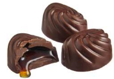
ШОКОЛАДНЫЕ КОНФЕТЫ С НАЧИНКОЙ «АБРИКОСОВЫЕ» Н/З CHOCOLATE CANDIES WITH FILLING "APRICOT" N/W 馅的巧克力夹心糖 "杏" N/W

Упаковка: весовая - 2,8 кг в г/к Weight packaging: 2,8 kg in a corrugated box 重量包装: 每个瓦楞纸箱2,8公斤