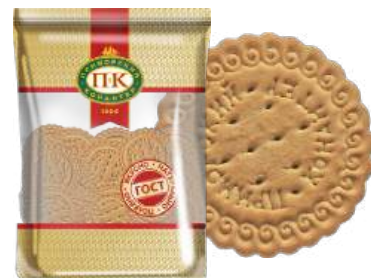
ПЕЧЕНЬЕ «НЕСЛАДКОЕ КЛАССИЧЕСКОЕ» COOKIES "UNSWEETENED CLASSICAL" 饼干 "不加糖的经典"

Упаковка: фрасованная - 1/400, 8 шт в г/к Filled packaging: 1/400, 8 pcs in a corrugated box 分包包装: 1/400, 每个瓦楞纸箱8个