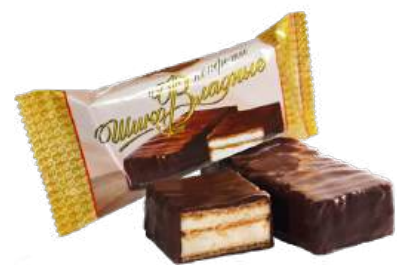
КОНФЕТЫ ВАФЕЛЬНЫЕ «ШИКОВЛАДНЫЕ» Т WAFFLE CANDIES "SHIKOVFLADNYE" S/W 窝夫夹心糖 "SHIKOVFLADNYE" S/W

Вафельные конфеты с начинкой из сливочной сбивной массы, покрытые шоколадной глазурью