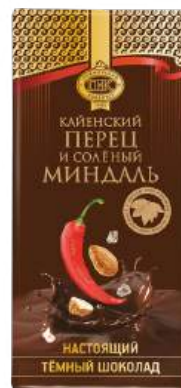
ШОКОЛАД ТЁМНЫЙ «ПРИМОРСКИЙ КОНДИТЕР» С КАЙЕНСКИМ ПЕРЦЕМ И СОЛЁНЫМ МИНДАЛЁМ DARK CHOCOLATE "PRIMORSKY KONDITER" WITH CAYENNE PEPPER AND SALTED ALMONDS 黑巧克力 (夹辣椒和咸杏仁)

Срок хранения: 6 месяцев Storage time: 6 months 保存期: 6个月