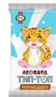
ШОКОЛАД МОЛОЧНЫЙ «ЛЕОПАРД ТИП-ТОП» MILK CHOCOLATE "LEOPARD TIP-TOP" "豹 Tip-Top" 牛奶巧克力

Срок хранения: 6 месяцев Storage time: 6 months 保存期: 6个月