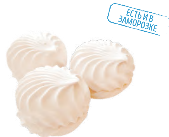
ЗЕФИР НЕГЛАЗИРОВАННЫЙ «ВАНИЛЬНЫЙ» ZEPHYR "VANILLA" 香草棉花糖

Зефир шарообразной формы рифленой поверхностью. Поверхность обсыпана сахарной пудрой. Содержит натуральный экстракт ванили Ball-shaped marshmallows with a corrugated surface. Surface sprinkled with powdered sugar. Contains natural vanilla extract 球形泽菲尔软糖表面有波浪。上面撒少许糖粉。包含纯天然香草精