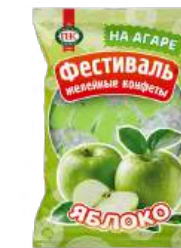
КОНФЕТЫ ЖЕЛЕЙНЫЕ НЕГЛАЗИРОВАННЫЕ «ФЕСТИВАЛЬ СО ВКУСОМ ЯБЛОКА» 1/250 UNGLAZED JELLY CANDIES "FESTIVAL WITH APPLE FLAVORED" 1/250 無釉果冻糖果 "节日 苹果味的" 1/250

Упаковка: фрасованная - 1/250, 18 шт в г/к Package: filled packaging - 1/250, 18 pcs in a corrugated box 包装: 分包包装-1/250 · 每个瓦楞纸18个