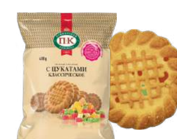
ПЕЧЕНЬЕ «КЛАССИЧЕСКОЕ С ЦУКАТАМИ» COOKIES "CLASSICAL WITH CANDIED FRUITS" 饼干 "经典蜜饯"

Упаковка: фрасованная - 1/400, 8 шт в г/к Filled packaging: 1/400, 8 pcs in a corrugated box 分包包装: 1/400, 每个瓦楞纸箱8个