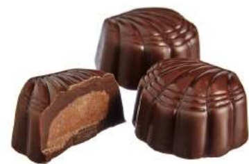
ШОКОЛАДНЫЕ КОНФЕТЫ С НАЧИНКОЙ «ШОКОЛАДНО-МИНДАЛЬНЫЕ» Н/З CHOCOLATE CANDIES WITH FILLING "CHOCOLATE AND ALMOND" N/W