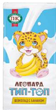
ШОКОЛАД МОЛОЧНЫЙ «ЛЕОПАРД ТИП-ТОП» С БАНАНОМ MILK CHOCOLATE "LEOPARD TIP-TOP" WITH BANANA "豹 Tip-Top" 牛奶巧克力 (配香蕉)

Срок хранения: 6 месяцев Storage time: 6 months 保存期: 6个月