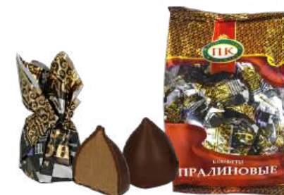
КОНФЕТЫ «ХОД КОНЁМ» В/П CANDIES «KNIGHT'S MOVE» W/T 夹心糖 "移骑士" W/T