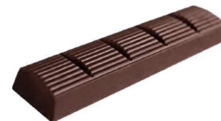
ШОКОЛАД ТЁМНЫЙ «ПРИМОРСКИЙ КОНДИТЕР» DARK CHOCOLATE "PRIMORSKY KONDITER" 黑巧克力

Упаковка: весовая – 5,4 кг в г/к Weight packaging: 5,4 kg in a corrugated box 重量包装: 每个瓦楞纸箱5,4公斤