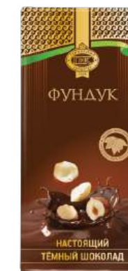
ШОКОЛАД ТЁМНЫЙ «ПРИМОРСКИЙ КОНДИТЕР» С ФУНДУКОМ "PRIMORSKY KONDITER" DARK CHOCOLATE WITH HAZELNUTS 黑巧克力 (配榛子)

Срок хранения: 12 месяцев Storage time: 12 months 保存期: 12个月