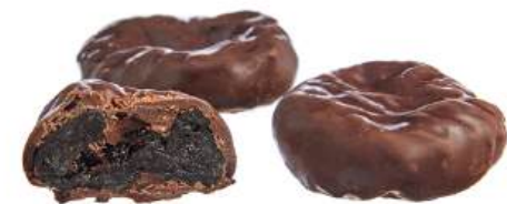
КОНФЕТЫ «СЛИВА В ШОКОЛАДЕ» Н/З CANDIES "CHOCOLATE-COVERED PLUM" N/W 夹心糖 "巧克力里的李子" N/W

Корпус - чернослив в шоколадной глазури Blown work base - chocolate glazed prunes 糖果 - 上巧克力釉的黑李子干