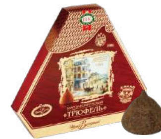
КОНФЕТЫ «ШИКОВЛАДНЫЙ ТРЮФЕЛЬ КЛАССИЧЕСКИЙ» 1/220 CANDIES "SHIKOVLADNYY TRUFFLE CLASSICAL" 1/220 “可口符拉迪” 经典 松露糖 1/220

Упаковка: фасованная - 1/220, 4 шт в г/к Filled packaging 1/220, 4 pcs in a corrugated box 分包包装: 1/220 · 每个瓦楞纸箱4个