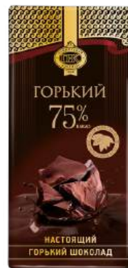
ШОКОЛАД ГОРЬКИЙ «ПРИМОРСКИЙ КОНДИТЕР» BITTER CHOCOLATE 75% COCAO "PRIMORSKY KONDITER" 苦味巧克力

Срок хранения: 12 месяцев Storage time: 12 months 保存期: 12个月