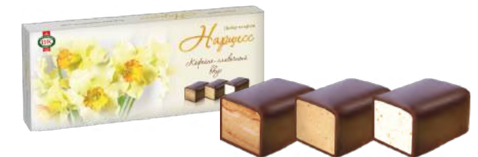
НАБОР КОНФЕТ «НАРЦИСС» С КОФЕЙНО-СЛИВОЧНЫМ ВКУСОМ 1/280 CANDY SET "NARCISSUS" COFFEE-CREAM FLAVOR 1/280 夹心糖 "咖啡奶油味水仙花" 1/280

Упаковка: фасованная - 1/110, 14 шт в г/к Filled packaging 1/110, 14 pcs in a corrugated box 分包包装: 1/110 · 每个瓦楞纸箱14个