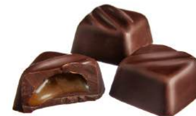
ШОКОЛАДНЫЕ КОНФЕТЫ С НАЧИНКОЙ «МОЛОЧНЫЕ» Н/З CHOCOLATE CANDIES WITH FILLING "MILKY" N/W 馅的巧克力夹心糖 "奶制品" N/W

Упаковка: весовая - 2,8 кг в г/к Weight packaging: 2,8 kg in a corrugated box 重量包装: 每个瓦楞纸箱2,8公斤