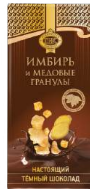
ШОКОЛАД ТЁМНЫЙ «ПРИМОРСКИЙ КОНДИТЕР» С ИМБИРЁМ И МЕДОВЫМИ ГРАНУЛАМИ "PRIMORSKY KONDITER" DARK CHOCOLATE WITH GINGER AND HONEY GRANULES 黑巧克力 (夹生姜和蜂蜜颗粒)

Срок хранения: 6 месяцев Storage time: 6 months 保存期: 6个月