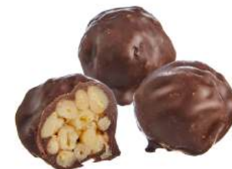
КОНФЕТЫ ГРИЛЯЖНЫЕ «ГРИЛЯЖ С КЕДРОВЫМ ОРЕХОМ» Н/З CANDIES WITH CANDIED ROASTED NUTS "WITH PINE NUT" N/W 坚果糖 "松子" N/W

Упаковка: весовая - 3 кг в г/к Weight packaging: 3 kg in a corrugated box 重量包装: 每个瓦楞纸箱3公斤