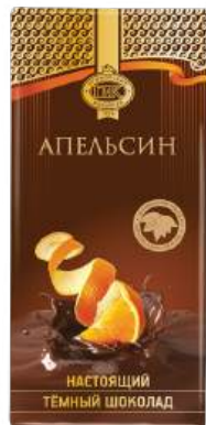
ШОКОЛАД ТЁМНЫЙ «ПРИМОРСКИЙ КОНДИТЕР» С АПЕЛЬСИНОМ DARK CHOCOLATE "PRIMORSKY KONDITER" WITH ORANGE 橙黑巧克力

Срок хранения: 6 месяцев Storage time: 6 months 保存期: 6个月