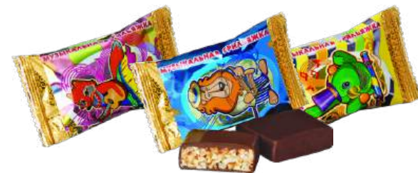
КОНФЕТЫ ГРИЛЯЖНЫЕ «МУЗЫКАЛЬНАЯ ГРИЛЯЖКА» Т CANDIES WITH CANDIED ROASTED NUTS "MUSICAL GRILLAGE" S/W 果仁糖的夹心糖 "音乐小果仁糖" S/W

Гриляжный корпус на основе ореха арахиса с добавлением мёда