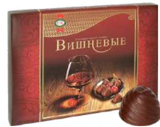
ШОКОЛАДНЫЕ КОНФЕТЫ ЛИКЁРНЫЕ «ВИШНЁВЫЕ» 1/195 LIQUEUR CANDIES "CHERRY" 1/195 “樱桃” 1/195

Шоколадные конфеты ликёрные «Вишнёвые» Chocolate candies with liqueur "Cherry" 力娇酒的巧克力糖 "樱桃"