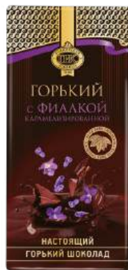
ШОКОЛАД ГОРЬКИЙ «ПРИМОРСКИЙ КОНДИТЕР» С КАРАМЕЛИЗИРОВАННОЙ ФИАЛКОЙ BITTER CHOCOLATE 75% COCAO "PRIMORSKY KONDITER" WITH CARAMELIZED VIOLET 苦味巧克力與焦糖紫羅蘭

Срок хранения: 6 месяцев Storage time: 6 months 保存期: 6个月