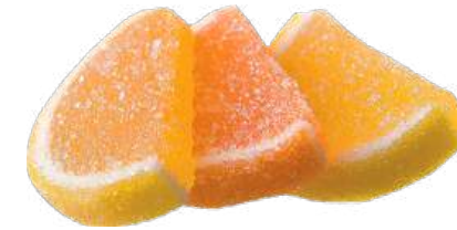
МАРМЕЛАД «ЦИТРУСОВЫЕ МАРМЕЛАДКИ» MARMALADE "CITRUS MARMELADES" 柑橘果酱

重量包装: 每个瓦楞纸箱8公斤 (每个瓦楞纸箱包括4个 "电视机" 包装·每个重量为2公斤)