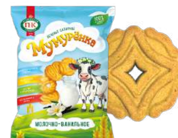
ПЕЧЕНЬЕ САХАРНОЕ«МУМУРЕНКА» МОЛОЧНО-ВАНИЛЬНОЕ SUGAR COOKIES "MUMURENKA" MILK-VANILLA 糖饼干 "MUMURENKA" 牛奶香草

Упаковка: фрасованная - 1/400 - 8 шт в г/к Filled packaging: 1/400, 8 pcs in a corrugated box 分包包装: 1/400, 每个瓦楞纸箱8个