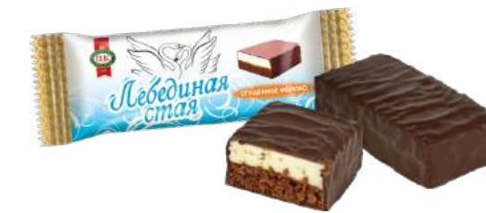
ПИРОЖНОЕ ШОКОЛАДНОЕ «ЛЕБЕДИНАЯ СТАЯ» СО СГУЩЕННЫМ МОЛОКОМ CHOCOLATE CAKE "SWAN FLOCK" WITH CONDENSED MILK 点心"天鹅群" (含炼乳)

Упаковка: весовая - 2,5 кг в г/к Package: weight - 2,5 kg in a corrugated box 包装: 重量-每个瓦楞纸2,5公斤