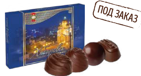
НАБОР КОНФЕТ «ВЕЧЕРНИЙ ХАБАРОВСК» 1/210 CANDY SET "EVENING HABAROVSK" 1/210 “晚上的哈巴洛夫斯克” 1/210

Упаковка: фрасованная - 1/200, 5 шт в г/к Filled packaging 1/200, 5 pcs in a corrugated box 分包包装: 1/200 · 每个瓦楞纸箱5个