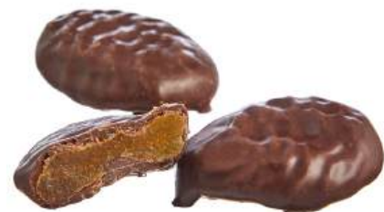
КОНФЕТЫ «КУРАГА В ШОКОЛАДЕ» Н/З CANDIES "DRIED APRICOT, COVERED WITH CHOCOLATE" N/W 夹心糖 "巧克力杏干" N/W

Упаковка: весовая - 4 кг в г/к Weight packaging: 4 kg in a corrugated box 重量包装: 每个瓦楞纸箱4公斤