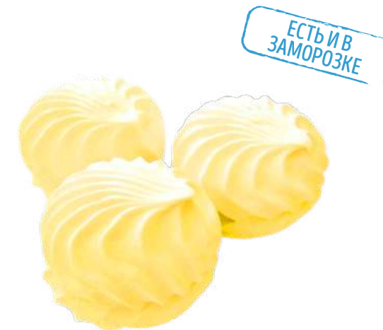
ЗЕФИР НЕГЛАЗИРОВАННЫЙ «СО ВКУСОМ АНАНАСА» ZEPHYR "WITH PINEAPPLE FLAVOUR" 菠萝味棉花糖

Упаковка: весовая - 2 кг в г/к (в г/к входит 2 упаковки «телевизор» по 1 кг) Weight packaging: 2 kg in a corrugated box (corrugated box includes 2 "TV" packs, 1 kg each) 重量包装: 每个瓦楞纸箱2公斤 (每个瓦楞纸箱包括2个“电视机”包装, 每个重量为1公斤)