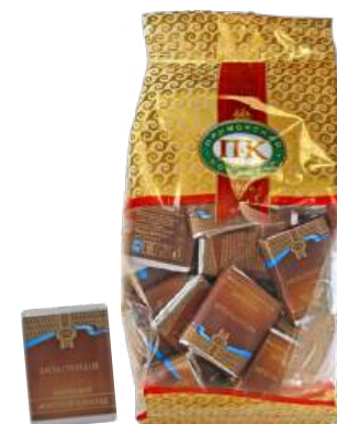
ШОКОЛАД МОЛОЧНЫЙ «ПРИМОРСКИЙ КОНДИТЕР» М В/З MILK CHOCOLATE "PRIMORSKY KONDITER" 牛奶巧克力

Срок хранения: 12 месяцев Storage time: 12 months 保存期: 12个月