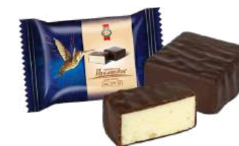
КОНФЕТЫ СБИВНЫЕ «ПРИМОРСКИЕ СЛИВОЧНЫЕ» Т BLOWN WORK "PRIMORSKIE CREAMY" S/W "PRIMORSKIE 奶油味的" 搅制夹心糖 S/W

Упаковка: весовая - 3 кг в г/к Package: weight package - 3 kg 包装: 论重量卖的商品 - 3公斤在g/k