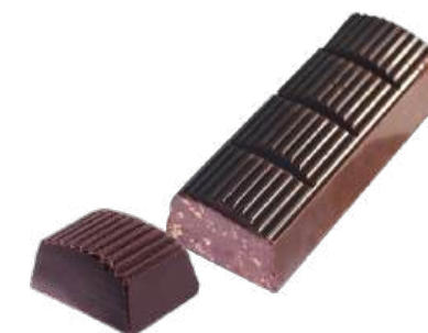
ШОКОЛАД ТЁМНЫЙ «ПРИМОРСКИЙ КОНДИТЕР» С ВАФЕЛЬНОЙ КРОШКОЙ DARK CHOCOLATE "PRIMORSKIY KONDITER" WITH WAFFLE CRUMBS 黑巧克力 (夹华夫饼屑)

Упаковка: весовая – 5,4 кг в г/к Weight packaging: 5,4 kg in a corrugated box 重量包装: 每个瓦楞纸箱5,4公斤