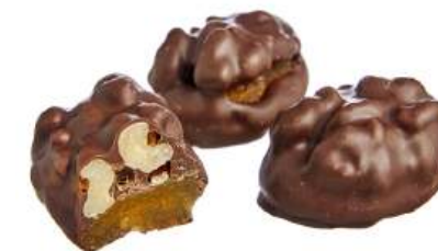
КОНФЕТЫ «АБРИКОС С ГРЕЦКИМ ОРЕХОМ В/Ш» Н/З CANDIES "WITH WALNUTS AND APRICOTS" N/W

Weight packaging: 7 kg in a corrugated box (corrugated box includes 2 "TV" packs, 3,5 kg each) 重量包装: 每个瓦楞纸箱7公斤 (每个瓦楞纸箱包括2个“电视机”包装·每个重量为3,5公斤)