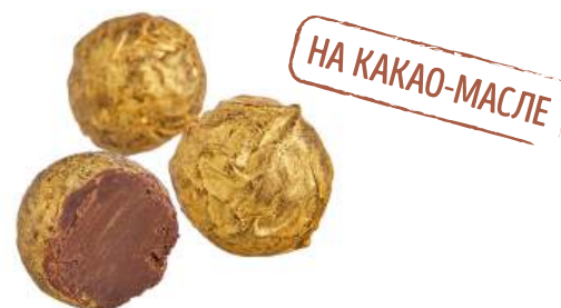
КОНФЕТЫ «ТРЮФЕЛЬ С ЛИКЁРОМ КУАНТРО» CANDIES "TRUFFLE WITH QUANTRO LIQUEUR" 夹心糖 "松露配君度利口酒"

Упаковка: весовая « телевизор » – 1,3 кг в г/к Weight packaging: "TV" - 1,3 kg in a corrugated box 重量包装: "电视机" -每个瓦楞纸箱1,3公斤