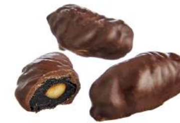
КОНФЕТЫ «ЧЕРНОСЛИВ В ШОКОЛАДЕ» Н/З CANDIES "PRUNE, COVERED WITH CHOCOLATE" N/W