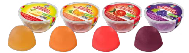
МАРМЕЛАД «С ГРУШЕВЫМ СОКОМ», «С АПЕЛЬСИНОВЫМ СОКОМ», «С ГРЕЙПФРУТОВЫМ СОКОМ», «С ВИНОГРАДНЫМ СОКОМ» MARMALADE "WITH PEAR JUICE", "WITH ORANGE JUICE", "WITH GRAPEFRUIT JUICE", "WITH GRAPE JUICE" 水果软糖“配梨汁”, “配橙汁”, “配西柚汁”, “搭配葡萄汁”

Упаковка: фрасованная - 1/200, 24 шт в г/к Filled packaging 1/200, 24 pcs in a corrugated box 分包包装: 1/200 · 每个瓦楞纸箱24个