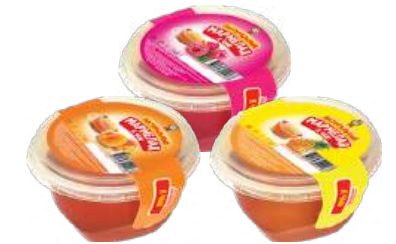
МАРМЕЛАД «К ЧАЮ» 1/200 MARMALADE "FOR TEA" 1/200 什锦茶1/200

Упаковка: фрасованная - 1/290, 15 шт в г/к Filled packaging 1/290, 15 pcs in a corrugated box 分包包装: 1/290 · 每个瓦楞纸箱15个