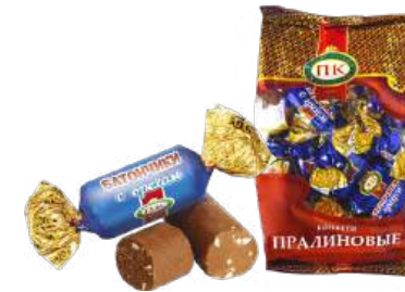
КОНФЕТЫ «БАТОНЧИКИ С ОРЕХОМ» В/П CANDIES "BARS WITH NUT" W/T 夹心糖 带坚果棒 (果仁糖型) W/T

Конфеты неглазированные с корпусом из пралиновой массы (батончик) с добавлением дроблёного арахиса