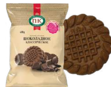
ПЕЧЕНЬЕ «КЛАССИЧЕСКОЕ ШОКОЛАДНОЕ» COOKIES "CLASSICAL CHOCOLATE" 饼干 "巧克力经典"

Упаковка: фрасованная - 1/400, 8 шт в г/к Filled packaging: 1/400, 8 pcs in a corrugated box 分包包装: 1/400, 每个瓦楞纸箱8个