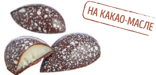
ШОКОЛАДНЫЕ КОНФЕТЫ С НАЧИНКОЙ «КОКОСОВЫЕ СЛИВКИ» CHOCOLATE CANDIES WITH FILLING "COCONUT CREAM" "椰子奶油" 馅料巧克力糖

Упаковка: весовая - 2,4 кг в г/к Weight packaging: 2,4 kg in a corrugated box 重量包装: 每个瓦楞纸箱2,4公斤