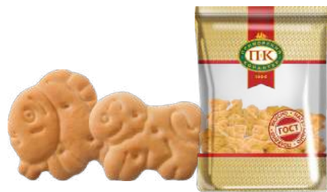
ПЕЧЕНЬЕ «ДРУЖНЫЕ ЗВЕРЯТА КЛАССИЧЕСКОЕ» COOKIES "FRIENDLY ANIMALS CLASSICAL" 饼干 "友好的小动物 经典"

Печенье в форме фигурок животных из затяжного теста Cookies in shape of animals made of prolong pastry 用漫长面团作·动物形的饼干