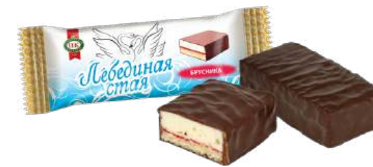
ПИРОЖНОЕ «ЛЕБЕДИНАЯ СТАЯ» С БРУСНИЧНОЙ НАЧИНКОЙ CAKE "SWAN FLOCK" WITH COWBERRY FILLING 点心"天鹅群" (含越橘馅)

Упаковка: ориентировочный вес тортов - 650 г; 1000 г; 2000 г Package: approximate weight of cakes - 650 g; 1000 g; 2000 g 包装: 大蛋糕的大约重量: 650克; 1000克; 2000克