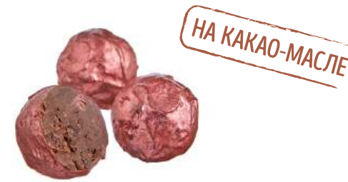
КОНФЕТЫ «ТРЮФЕЛЬ С КЛЮКВОЙ И КОНЬЯКОМ» CANDIES "TRUFFLE WITH CRANBERRY AND COGNAC" 夹心糖 "配蔓越莓和干邑白兰地松露"

Упаковка: весовая « телевизор » – 1,3 кг в г/к Weight packaging: "TV" - 1,3 kg in a corrugated box 重量包装: "电视机" -每个瓦楞纸箱1,3公斤