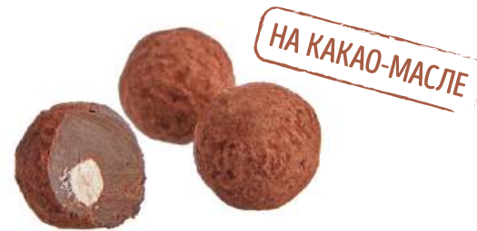
КОНФЕТЫ «ТРЮФЕЛЬ С ЧЕРЕШНЕЙ» CANDIES "TRUFFLE WITH CHERRIES" 夹心糖 "松露和樱桃"

Конфеты трюфель с черешней Chocolate cherry truffle 樱桃松露巧克力