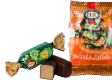
КОНФЕТЫ «СЛИВОЧНО-ПОМАДНЫЕ» В/П CANDIES "CREAMY FONDANT" W/T 夹心糖 "奶油软糖糖馅" W/T

包装: 重量-每个瓦楞纸6公斤·重量-每个瓦楞纸6公斤1个·分包包装-1/250·每个瓦楞纸18个