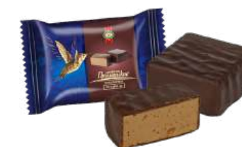
КОНФЕТЫ СБИВНЫЕ «ПРИМОРСКИЕ ШОКОЛАДНЫЕ» Т BLOWN WORK "PRIMORSKIE CHOCOLATE" S/W 搅制夹心糖 "PRIMORSKIE 巧克力" S/W

Упаковка: весовая - 3 кг в г/к Package: weight package - 3 kg 包装: 论重量卖的商品 - 3公斤在g/k