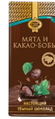
ШОКОЛАД ТЁМНЫЙ «ПРИМОРСКИЙ КОНДИТЕР» С МЯТОЙ И КАКАО-БОБАМИ DARK CHOCOLATE "PRIMORSKY KONDITER" WITH MINT AND COCOA BEANS 黑巧克力 (配薄荷和可可豆)

分包包装: 1/100 · 每个展示盒18个 · 每个瓦楞纸箱3个展示盒; 分包包装: 1/65 · 每个展示盒 22个 · 每个瓦楞纸箱4个展示盒