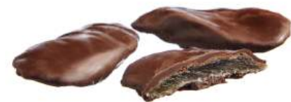
КОНФЕТЫ «АНАНАС В ТЁМНОЙ ГЛАЗУРИ» Н/З CANDIES "PINEAPPLE, COVERED WITH DARK GLAZE" N/W 夹心糖 "黑釉菠萝糖" N/W

Упаковка: весовая - 3 кг в г/к Weight packaging: 3 kg in a corrugated box 重量包装: 每个瓦楞纸箱3公斤