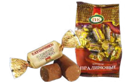
КОНФЕТЫ «БАТОНЧИКИ С КРОШКОЙ ПЕЧЕНЬЯ» В/П CANDIES "BARS WITH CRUMBS OF COOKIES" W/T 夹心糖 "带饼干屑的" 华夫饼 W/T

Конфеты неглазированные с добавлением молочной сыворотки и крошки печенья