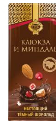
ШОКОЛАД ТЁМНЫЙ «ПРИМОРСКИЙ КОНДИТЕР» С КЛЮКВОЙ И МИНДАЛЁМ DARK CHOCOLATE "PRIMORSKY KONDITER" WITH CRANBERRIES AND ALMONDS 黑巧克力 (配蔓越莓和杏仁)

Срок хранения: 6 месяцев Shelf life: 6 months 保质期: 6个月