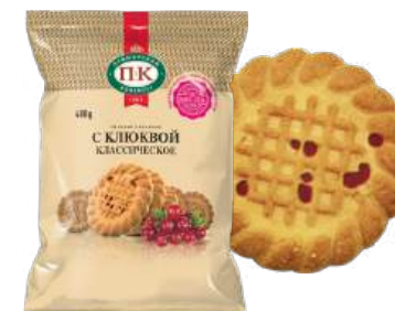
ПЕЧЕНЬЕ «КЛАССИЧЕСКОЕ С КЛЮКВОЙ» COOKIES "CLASSICAL WITH CRANBERRY" 饼干 "蔓越莓经典"

Упаковка: фрасованная - 1/300, 20 шт в г/к Filled packaging: 1/300, 20 pcs in a corrugated box 分包包装: 1/300, 每个瓦楞纸箱20个