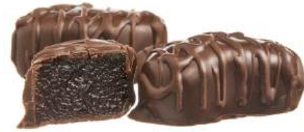
КОНФЕТЫ ФРУКТОВЫЕ «ЖУРАВЛИНАЯ СТАЯ» Н/З FRUIT CANDIES "CRANE FLOCK" N/W 水果夹心糖果 "鹤群" N/W

Конфеты железные с добавлением яблочного пюре Jelly candies based on applesauce 基于苹果泥的果冻夹心糖