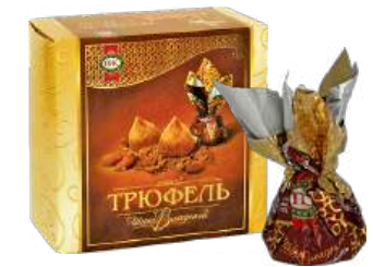
КОНФЕТЫ «ШИКОВЛАДНЫЙ ТРЮФЕЛЬ» 1/110 CANDIES "SHIKOVLADNYY TRUFFLE" 1/110 “可口符拉迪” 松露糖 1/110

Упаковка: фасованная - 1/280, 10 шт в г/к Filled packaging 1/280, 10 pcs in a corrugated box 分包包装: 1/280 · 每个瓦楞纸箱10个