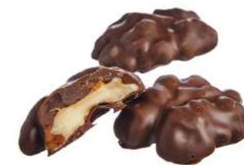
КОНФЕТЫ «ГРЕЦКИЙ ОРЕХ В ШОКОЛАДЕ» Н/З CANDIES "WALNUT, COVERED WITH CHOCOLATE" N/W