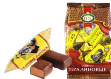
КОНФЕТЫ «ЗАДОРНЫЙ ГАЛЧОНОК» В/Н CANDIES «PERKY LITTLE JACKDAW» S 夹心糖 "活泼寒鸦" S

Конфеты глазированные кондитерской глазурью с добавлением крошки печенья, молочной сыворотки, ароматизатора «сливки» Candies coated with confectionery coating with cookie crumb, milk whey, "cream" flavoring matter