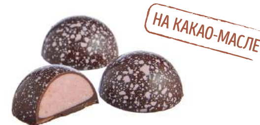
ШОКОЛАДНЫЕ КОНФЕТЫ С НАЧИНКОЙ «ЛЕСНЫЕ ЯГОДЫ» CHOCOLATE CANDIES WITH FILLING "WILD BERRIES" "野生浆果" 馅料巧克力糖

Упаковка: весовая - 1,8 кг в г/к Weight packaging: 1,8 kg in a corrugated box 重量包装: 每个瓦楞纸箱1,8公斤