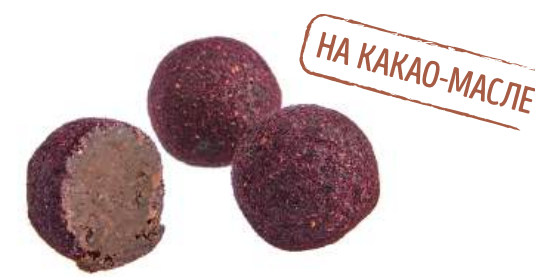
КОНФЕТЫ «ТРЮФЕЛЬ С ИЗЮМОМ И ЛИКЕРОМ ЯГЕРМАЙСТЕР» CANDIES "TRUFFLE WITH SULTANAS AND JEGERMEISTER LIQUEUR" 夹心糖 "葡萄干和埃格梅斯特利口酒松露糖"

Упаковка: весовая « телевизор » – 1,3 кг в г/к Weight packaging: "TV" - 1,3 kg in a corrugated box 重量包装: "电视机" -每个瓦楞纸箱1,3公斤