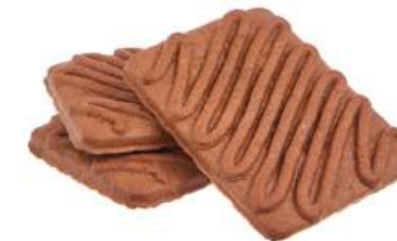
ПЕЧЕНЬЕ «ТРЮФЕЛЬНОЕ КЛАССИЧЕСКОЕ» COOKIES "TRUFFLE CLASSICAL" 饼干 "松露经典"

Упаковка: весовая - 5 кг в г/к Weight packaging: 5 kg in a corrugated box 重量包装: 每个瓦楞纸箱5公斤