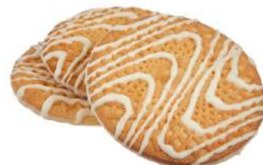
ПЕЧЕНЬЕ «ВАНИЛЬНОЕ ДЕКОРИРОВАННОЕ БЕЛОЙ ГЛАЗУРЬЮ» COOKIES "VANILLA, DECORATED WITH WHITE GLAZE" 饼干 "香草白釉"

重量包装: 每个瓦楞纸箱3,2公斤 (每个瓦楞纸箱包括2个“电视机”包装·每个重量为1,6 公斤)