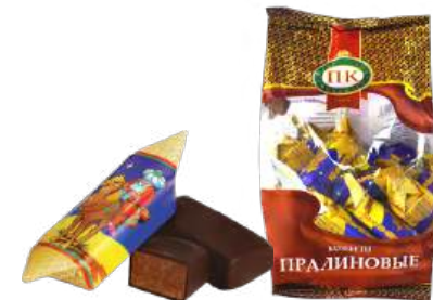
КОНФЕТЫ «МИНДАЛЬНО-ПРАЛИНОВЫЕ» В/Н CANDIES «ALMOND AND PRALINE» S 夹心糖 "杏仁果仁糖馅" S

Конфеты с пралиновым корпусом с добавлением тёртого ореха миндаля, арахиса, какао тёртого, эквивалент масла какао, масла сливочного