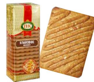
ПЕЧЕНЬЕ «ЗЛАКОВОЕ ОВСЯНОЕ» COOKIES "CEREAL OATMEAL" 饼干 "麦片燕麦片"

Упаковка: фасованная - 1/380, 20 шт в г/к Filled packaging: 1/380, 20 pcs in a corrugated box 分包包装: 1/380, 每个瓦楞纸箱20个