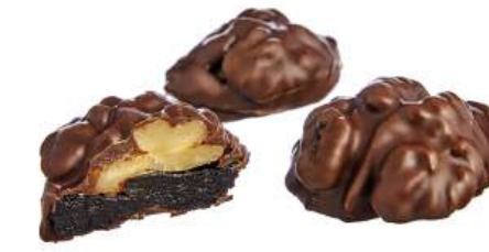
КОНФЕТЫ «ЧЕРНОСЛИВ С ГРЕЦКИМ ОРЕХОМ В/Ш» Н/З CANDIES "PRUNES WITH WALNUTS" N/W