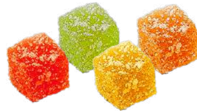
МАРМЕЛАД «С ЛИМОНОМ», «С АПЕЛЬСИНОМ», «С ГРЕЙПРУТОМ», «С АНАНАСОМ» MARMALADE "WITH LEMON", "WITH ORANGE", "WITH GRAPEFRUIT", "WITH PINEAPPLE"

Упаковка: весовая – 5 кг в г/к Weight packaging: 5 kg in a corrugated box 重量包装: 每个瓦楞纸箱5公斤