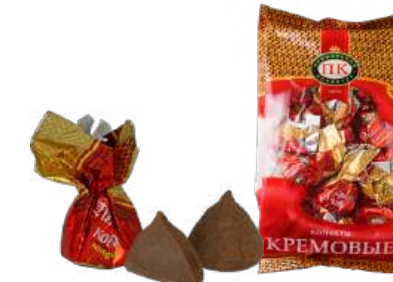
КОНФЕТЫ «ПИОНЕРСКИЙ КОСТЁР» В/П CANDIES "PIONEER FIRE" W/T 夹心糖 "先锋营火" W/T

包装: 分包包装-1/200 · 每个瓦楞纸16个 · 论个的商品 - 0.6公斤 · 6个在g/k