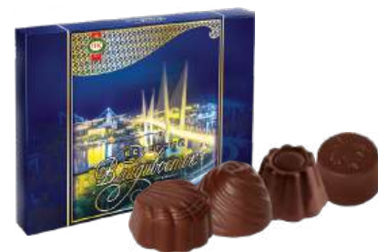
НАБОР КОНФЕТ «ВЕЧЕРНИЙ ВЛАДИВОСТОК» 1/200 CANDY SET "EVENING VLADIVOSTOK" 1/200 “晚上的弗拉迪沃斯托克” 1/200

Упаковка: фрасованная - 1/450, 2 шт в г/к Filled packaging 1/450, 2 pcs in a corrugated box 分包包装: 1/450 · 每个瓦楞纸箱2个