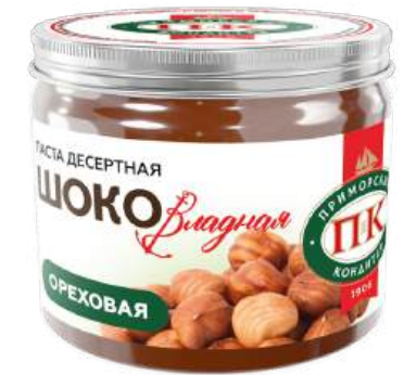
ПАСТА ДЕСЕРТНАЯ ОРЕХОВАЯ «ШОКОВЛАДНАЯ» С ФУНДУКОМ 1/200 PEANUT DESSERT BUTTER "SHOKOVLADNAYA WITH HAZELNUT" 1/200 “可口符拉迪” 甜点坚果酱 (配榛子)1/200

Упаковка: фасованная - 1/200, 16 шт в г/к Filled packaging: 1/200, 16 pcs in a corrugated box 分包包装: 1/200 · 每个瓦楞纸箱16个