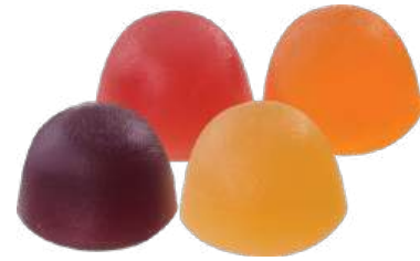
МАРМЕЛАД «С ГРУШЕВЫМ СОКОМ», «С АПЕЛЬСИНОВЫМ СОКОМ», «С ГРЕЙПФРУТОВЫМ СОКОМ», «С ВИНОГРАДНЫМ СОКОМ» MARMALADE "WITH PEAR JUICE", "WITH ORANGE JUICE", "WITH GRAPEFRUIT JUICE", "WITH GRAPE JUICE"

重量包装: 每个瓦楞纸箱8公斤 (每个瓦楞纸箱包括4个 "电视机" 包装·每个重量为2公斤)