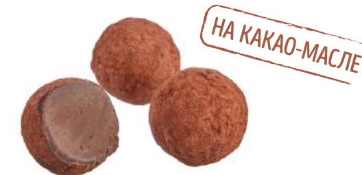
КОНФЕТЫ «ТРИЮФЕЛЬ КЛАССИЧЕСКИЙ» CANDIES "TRUFFLE CLASSIC" 夹心糖 "松露经典"

Упаковка: весовая - 2,4 кг в г/к Weight packaging: 2,4 kg in a corrugated box 重量包装: 每个瓦楞纸箱2,4公斤