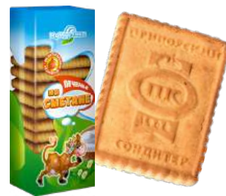
ПЕЧЕНЬЕ «МУМУРЁНКА» НА СМЕТАНЕ COOKIES "MUMURENKA" BASED ON SOUR CREAM "MUMURENKA"酸奶油饼干

Упаковка: фасованная - 1/380, 20 шт в г/к Filled packaging: 1/380, 20 pcs in a corrugated box 分包包装: 1/380, 每个瓦楞纸箱20个