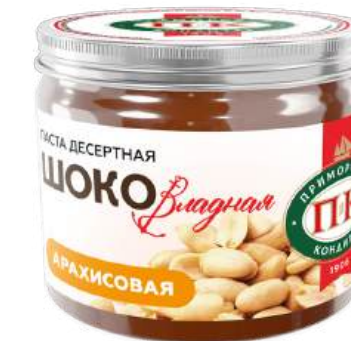
ПАСТА ДЕСЕРТНАЯ АРАХИСОВАЯ «ШОКОВЛАДНАЯ» 1/200 PEANUT DESSERT PASTE "SHOKOVLADNAYA" 1/200 “可口符拉迪” 甜点花生酱 1/200

Упаковка: фасованная - 1/200, 16 шт в г/к Filled packaging: 1/200, 16 pcs in a corrugated box 分包包装: 1/200 · 每个瓦楞纸箱16个