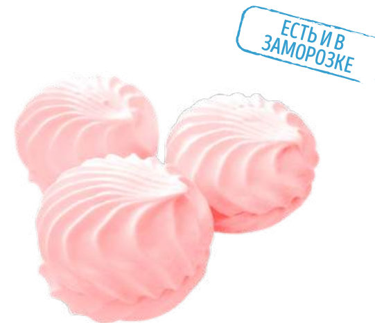
ЗЕФИР НЕГЛАЗИРОВАННЫЙ «СО ВКУСОМ КЛУБНИКИ» ZEPHYR "WITH STRAWBERRY FLAVOUR" 草莓味棉花糖

Упаковка: весовая - 2 кг в г/к (в г/к входит 2 упаковки «телевизор» по 1 кг) Weight packaging: 2 kg in a corrugated box (corrugated box includes 2 "TV" packs, 1 kg each) 重量包装: 每个瓦楞纸箱2公斤 (每个瓦楞纸箱包括2个“电视机”包装, 每个重量为1公斤)