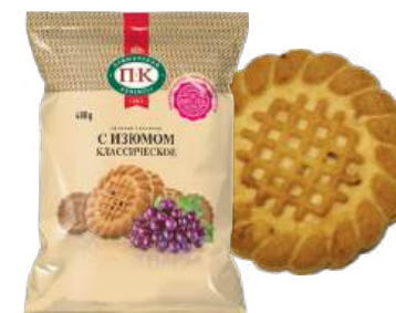
ПЕЧЕНЬЕ «КЛАССИЧЕСКОЕ С ИЗЮМОМ» COOKIES "CLASSICAL WITH RAISIN" 饼干 "经典葡萄干"

Упаковка: фрасованная - 1/400, 8 шт в г/к Filled packaging: 1/400, 8 pcs in a corrugated box 分包包装: 1/400, 每个瓦楞纸箱8个