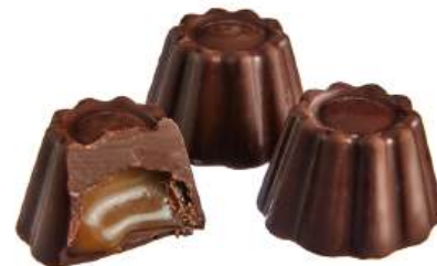
ШОКОЛАДНЫЕ КОНФЕТЫ ЛИКЁРНЫЕ «СО ВКУСОМ БЕЙЛИЗ» Н/З CHOCOLATE CANDIES WITH LIQUEUR "WITH BAILEYS LIQUEUR" N/W 力娇酒的巧克力糖 "与百利甜酒" N/W

Упаковка: весовая - 2,8 кг в г/к Weight packaging: 2,8 kg in a corrugated box 重量包装: 每个瓦楞纸箱2,8公斤