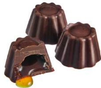
ШОКОЛАДНЫЕ КОНФЕТЫ ЛИКЁРНЫЕ «АПЕЛЬСИНОВЫЕ» Н/З CHOCOLATE CANDIES WITH LIQUEUR "ORANGE" N/W 力娇酒的巧克力糖 "橙子" N/W

Упаковка: весовая - 2,4 кг в г/к Weight packaging: 2,4 kg in a corrugated box 重量包装: 每个瓦楞纸箱2,4公斤