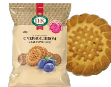
ПЕЧЕНЬЕ «КЛАССИЧЕСКОЕ С ЧЕРНОСЛИВОМ» COOKIES "CLASSICAL WITH PRUNE" 饼干 "黑李子经典"

Упаковка: фрасованная - 1/400, 8 шт в г/к Filled packaging: 1/400, 8 pcs in a corrugated box 分包包装: 1/400, 每个瓦楞纸箱8个