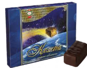
КОНФЕТЫ ГРИЛЛЯЖНЫЕ «КОМЕТА» 1/310 CANDIED ROASTED NUTS "COMET" 1/310 “陨星”糖 1/310

Упаковка: фрасованная - 1/210, 4 шт в г/к Filled packaging 1/210, 4 pcs in a corrugated box 分包包装: 1/210 · 每个瓦楞纸箱4个