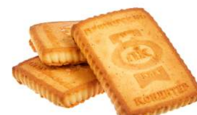
ПЕЧЕНЬЕ «ТВОРОЖНОЕ» COOKIES "CURD" 饼干 "凝乳"

Упаковка: весовая – 5 кг в г/к Weight packaging: 5 kg in a corrugated box 重量包装: 每个瓦楞纸箱5公斤