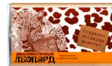
ШОКОЛАД ТЁМНЫЙ «ДАЛЬНЕВОСТОЧНЫЙ ЛЕОПАРД» С ВАФЕЛЬНОЙ КРОШКОЙ 1/65 DARK CHOCOLATE "FAR EASTERN LEOPARD" WITH WAFFLE CRUMB 1/65 "远东豹" 巧克力 1/65

Срок хранения: 12 месяцев Storage time: 12 months 保存期: 12个月