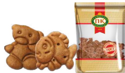
ПЕЧЕНЬЕ «ДРУЖНЫЕ ЗВЕРЯТА ШОКОЛАДНОЕ» COOKIES "FRIENDLY ANIMALS CHOCOLATE" 饼干 "友好的小动物 巧克力"

Упаковка: фрасованная - 1/400, 8 шт в г/к Filled packaging: 1/400, 8 pcs in a corrugated box 分包包装: 1/400, 每个瓦楞纸箱8个