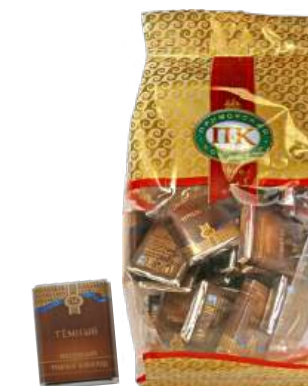
ШОКОЛАД ТЁМНЫЙ «ПРИМОРСКИЙ КОНДИТЕР» М В/З DARK CHOCOLATE "PRIMORSKY KONDITER" 黑巧克力

分包包装: 1/150 · 1条的重量5克 · 1/150, 每个瓦楞纸箱24条