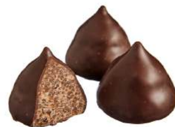
КОНФЕТЫ «МЕГАФИШКА» Н/З CANDIES "MEGAFISHKA" N/W