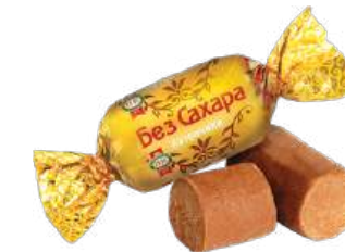
КОНФЕТЫ «БАТОНЧИКИ БЕЗ САХАРА» В/П CANDIES "BARS WITHOUT SUGAR" W/T 夹心糖 无糖棒 W/T

Конфеты неглазированные с корпусом из пралиновой массы батончик