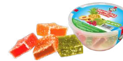
МАРМЕЛАД «АССОРТИ» MARMALADE "ASSORTI" 水果软糖“什锦”

Упаковка: фрасованная - 1/300, 10 шт в г/к Filled packaging 1/300, 10 pcs in a corrugated box 分包包装: 1/300 · 每个瓦楞纸箱10个