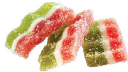
МАРМЕЛАД «ТРЕХСЛОЙНЫЙ» MARMALADE "THREE-LAYERED" 水果软糖 "三层的"

Мармелад на основе агара с добавлением яблочного пюре. Форма прямоугольная, рифленая. Мармелад обсыпан сахаром Agar-based marmalade with applesauce. The shape is rectangular, corrugated. Marmalade is sprinkled with sugar