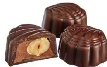
ШОКОЛАДНЫЕ КОНФЕТЫ С НАЧИНКОЙ «КРЕМОВЫЕ С ЦЕЛЬНЫМ ФУНДУКОМ» Н/З CHOCOLATE CANDIES WITH FILLING "CREAM WITH WHOLE HAZELNUT" N/W 带馅的巧克力夹心糖 "奶油配整个榛子" N/W

Упаковка: весовая - 4 кг в г/к Weight packaging: 4 kg in a corrugated box 重量包装: 每个瓦楞纸箱4公斤