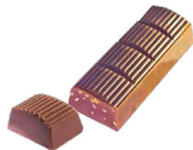
ШОКОЛАД МОЛОЧНЫЙ «ПРИМОРСКИЙ КОНДИТЕР» С КУНЖУТОМ MILK CHOCOLATE "PRIMORSKY KONDITER" WITH SESAME SEEDS 牛奶巧克力 (加芝麻)

Упаковка: весовая – 5,4 кг в г/к Weight packaging: 5,4 kg in a corrugated box 重量包装: 每个瓦楞纸箱5,4公斤