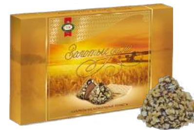
КОНФЕТЫ «ЗОЛОТЫЕ ДАЛИ» 1/220 CANDIES "ZOLOTYYE DALI" 1/220 夹心糖 "黄金距离" 1/220

Упаковка: фасованная - 1/205, 5 шт в г/к Filled packaging 1/205, 5 pcs in a corrugated box 分包包装: 1/205 · 每个瓦楞纸箱5个