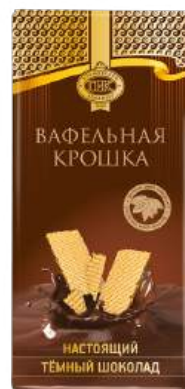
ШОКОЛАД ТЁМНЫЙ «ПРИМОРСКИЙ КОНДИТЕР» С ВАФЕЛЬНОЙ КРОШКОЙ DARK CHOCOLATE "PRIMORSKY KONDITER" WITH WAFFLE CRUMBS 黑巧克力 (配华夫饼屑)

Срок хранения: 12 месяцев Storage time: 12 months 保存期: 12个月