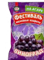
КОНФЕТЫ ЖЕЛЕЙНЫЕ НЕГЛАЗИРОВАННЫЕ «ФЕСТИВАЛЬ СО ВКУСОМ ВИНОГРАДА» 1/250 UNGLAZED JELLY CANDIES "FESTIVAL WITH GRAPE FLAVORED" 1/250 無釉果冻糖果 "节日 带有葡萄味" 1/250

Упаковка: фрасованная - 1/250, 18 шт в г/к, весовая - 1 кг, 6 шт в г/к Package: filled packaging - 1/250, 18 pcs in a corrugated box, weight - 1 kg, 6 pcs in a corrugated box 包装: 分包包装-1/250 · 每个瓦楞纸18个, 重量-分包包装-1公斤 · 每个瓦楞纸6个