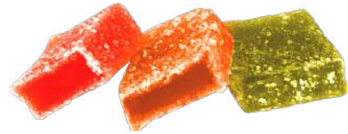
МАРМЕЛАД «АССОРТИ» MARMALADE "ASSORTI" 水果软糖 "什锦"

Разноцветный мармелад прямоугольной формы на основе агара. Различных ароматов и цветов. Поверхность обсыпана сахаром Rectangular multi-colored marmalade based on agar. Of various flavors and colors. The surface is sprinkled with sugar