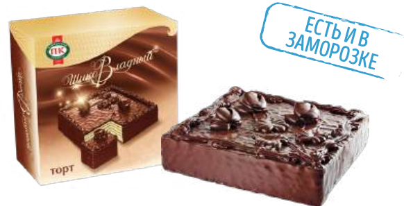
ТОРТ ВАФЕЛЬНЫЙ «ШИКОВЛАДНЫЙ» В ШОКОЛАДНОЙ ГЛАЗУРИ WAFFLE CAKE "SHIKOVVLADNY" IN CHOCOLATE GLAZE 巧克力釉华夫饼 "ShikoVladny"

Вафельный торт с прослойкой из сбивной массы. Покрыт тёмной шоколадной глазурью и декорирован вручную. Упакован в коробку, вес торта проставляется на коробке Waffle cake with a layer of blown mass. Covered with dark chocolate coating and decorated by hand. Packed in a box, the weight of the cake is marked on the box 一层搅打浆的窝夫大蛋糕。表面上有黑巧克力淋面·手工装饰。在一个盒子里打包·蛋糕的重量在盒子上填写