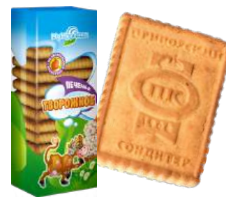
ПЕЧЕНЬЕ «МУМУРЁНКА» ТВОРОЖНОЕ COOKIES "MUMURENKA" CURD "MUMURENKA"凝乳饼干

Упаковка: фасованная - 1/380, 20 шт в г/к Filled packaging: 1/380, 20 pcs in a corrugated box 分包包装: 1/380, 每个瓦楞纸箱20个