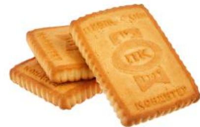
ПЕЧЕНЬЕ «НА СМЕТАНЕ» COOKIES "BASED ON SOUR CREAM" 饼干 "酸奶油"

Упаковка: весовая – 5 кг в г/к Weight packaging: 5 kg in a corrugated box 重量包装: 每个瓦楞纸箱5公斤