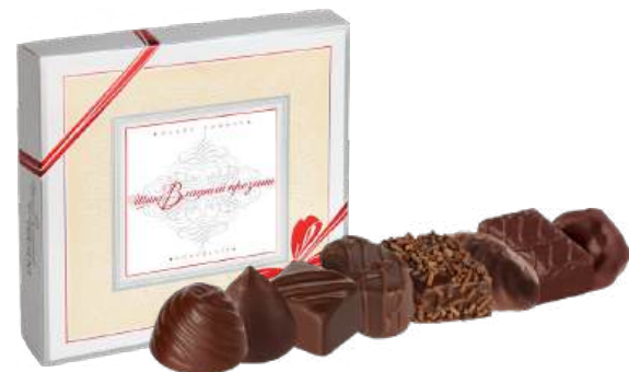
НАБОР КОНФЕТ «ШИКОВЛАДНЫЙ ПРЕЗЕНТ» 1/450 CANDY SET "SHIKOVLADNYJ PREZENT" 1/450 “可口符拉迪”礼物”糖 1/450

В набор входят шоколадные конфеты с начинками: «Молочные», шоколадные конфеты ликёрные «Коньячные», конфеты из сухофруктов и орехов глазированные шоколадной глазурью «Чернослив в шоколаде», конфеты грильяжные мягкие глазированные шоколадной глазурью «ШикоВладный метеорит», конфеты кремовые глазированные шоколадной глазурью «Люкс», «Кремовые», конфеты кремовые глазированные кондитерской глазурью «МегаФишка», конфеты фруктовые глазированные кондитерской глазурью «Журавлиная стая». Уложены в два яруса