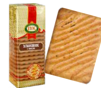
ПЕЧЕНЬЕ «ЗЛАКОВОЕ С МЮСЛИ» COOKIES "CEREAL WITH MUESLI" 饼干 "夹麦片"

Упаковка: фасованная - 1/300, 20 шт в г/к Filled packaging: 1/300, 20 pcs in a corrugated box 分包包装: 1/300, 每个瓦楞纸箱20个