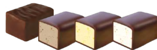
КОНФЕТЫ «НАРЦИСС» Н/З CANDIES "NARCISSUS" N/W