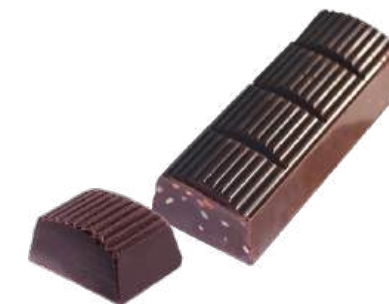
ШОКОЛАД ТЁМНЫЙ «ПРИМОРСКИЙ КОНДИТЕР» С КУНЖУТОМ DARK CHOCOLATE "PRIMORSKY KONDITER" WITH SESAME SEEDS 芝麻黑巧克力

Упаковка: весовая – 5,4 кг в г/к Weight packaging: 5,4 kg in a corrugated box 重量包装: 每个瓦楞纸箱5,4公斤