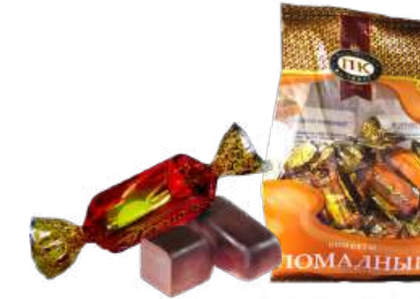
КОНФЕТЫ «ШАМОРА» В/П CANDIES "SHAMORA" W/T 夹心糖 "莎莫拉湾" W/T

Конфеты с молочным помадным корпусом с добавлением сгущенного молока, какао-порошка и ароматизатора «масло ваниль»