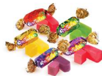
КОНФЕТЫ ЖЕЛЕЙНЫЕ НА ОСНОВЕ АГАРА: «ФЕСТИВАЛЬ СО ВКУСОМ АПЕЛЬСИНА» В/З, «ФЕСТИВАЛЬ СО ВКУСОМ АНАНАСА» В/З, «ФЕСТИВАЛЬ СО ВКУСОМ ЛЕСНЫХ ЯГОД» В/З, «ФЕСТИВАЛЬ СО ВКУСОМ ВИНОГРАДА» В/З, «ФЕСТИВАЛЬ СО ВКУСОМ ЯБЛОКА» В/З, «ФЕСТИВАЛЬ СО ВКУСОМ ВИШНИ» В/З

Упаковка: фрасованная - 1/150, 10 шт в г/к Filled packaging 1/150, 10 pcs in a corrugated box 分包包装: 1/150 · 每个瓦楞纸箱10个