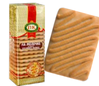
ПЕЧЕНЬЕ «НА МОЛОЧКЕ СО ВКУСОМ ТОПЛЁНОГО МОЛОКА» COOKIES "BASED ON MILK WITH BAKED MILK FLAVOUR" 饼干 "带有烤牛奶味的牛奶饼干"

Упаковка: фасованная - 1/300, 20 шт в г/к Filled packaging: 1/300, 20 pcs in a corrugated box 分包包装: 1/300, 每个瓦楞纸箱20个