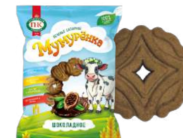
ПЕЧЕНЬЕ САХАРНОЕ«МУМУРЕНКА» ШОКОЛАДНОЕ SUGAR COOKIES "MUMURENKA" CHOCOLATE 糖饼干 "MUMURENKA" 巧克力

Упаковка: фрасованная - 1/180, 10 шт в г/к Filled packaging: 1/180, 10 pcs in a corrugated box 分包包装: 1/180, 每个瓦楞纸箱10个