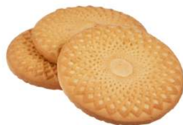
ПЕЧЕНЬЕ «ВАНИЛЬНОЕ КЛАССИЧЕСКОЕ» COOKIES "VANILLA CLASSICAL" 饼干 "香草经典"

Упаковка: весовая – 5 кг в г/к Weight packaging: 5 kg in a corrugated box 重量包装: 每个瓦楞纸箱5公斤