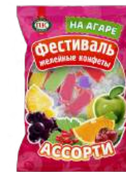
КОНФЕТЫ ЖЕЛЕЙНЫЕ «ФЕСТИВАЛЬ МИКС» В/З 1/250 JELLY CANDIES "FESTIVAL MIX" W/T 1/250 果冻夹心糖 "节日 混合" W/T 1/250

Упаковка: весовая - 1 кг, 6 шт в г/к Weight packaging: 1 kg, 6 pcs in a corrugated box 重量包装: 重量-分包包装 1 公斤 · 每个瓦楞纸6个