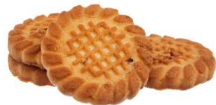
ПЕЧЕНЬЕ «КЛАССИЧЕСКОЕ С ЧЕРНОСЛИВОМ» COOKIES "CLASSICAL WITH PRUNE" 饼干 "经典黑李子"

Упаковка: весовая - 5 кг в г/к Weight packaging: 5 kg in a corrugated box 重量包装: 每个瓦楞纸箱5公斤