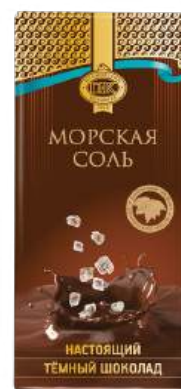
ШОКОЛАД ТЁМНЫЙ «ПРИМОРСКИЙ КОНДИТЕР» С МОРСКОЙ СОЛЬЮ DARK CHOCOLATE "PRIMORSKY KONDITER" WITH SEA SALT 黑巧克力(加海盐)

Срок хранения: 12 месяцев Storage time: 12 months 保存期: 12个月