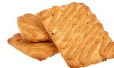
ПЕЧЕНЬЕ «ЗЛАКОВОЕ С МЮСЛИ» COOKIES "CEREAL WITH MUESLI" 饼干 "带麦片"

Упаковка: весовая - 5 кг в г/к Weight packaging: 5 kg in a corrugated box 重量包装: 每个瓦楞纸箱5公斤