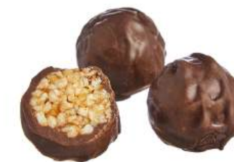
КОНФЕТЫ ГРИЛЯЖНЫЕ «ШИКОВЛАДНЫЙ МЕТЕОРИТ» Н/З CANDIES WITH CANDIED ROASTED NUTS "SHIKOVLADNY METEORITE" N/W 坚果糖 "可口符拉迪的陨星" N/W

Упаковка: весовая - 5 кг в г/к Weight packaging: 5 kg in a corrugated box 重量包装: 每个瓦楞纸箱5公斤