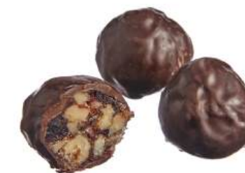
КОНФЕТЫ ГРИЛЯЖНЫЕ «ГРИЛЯЖ С ГРЕЦКИМ ОРЕХОМ И КЛЮКВОЙ» Н/З CANDIED ROASTED NUTS "GRILLAGE WITH WALNUTS AND CRANBERRIES" N/W 坚果糖 "核桃和蔓越莓" N/W

Упаковка: весовая - 3 кг в г/к Weight packaging: 3 kg in a corrugated box 重量包装: 每个瓦楞纸箱3公斤