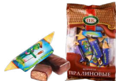
КОНФЕТЫ «ПРАЛИНОВЫЕ С КУНЖУТОМ» В/Н CANDIES «PRALINE WITH SESAME» S 夹心糖 "芝麻果仁糖" S

Конфеты глазированные кондитерской глазурью с добавлением жареного кунжутного семени