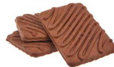
ПЕЧЕНЬЕ «ТРЮФЕЛЬНОЕ С КОРИЦЕЙ» COOKIES "TRUFFLE WITH CINNAMONE" 饼干 "肉桂松露"

Упаковка: весовая - 5 кг в г/к Weight packaging: 5 kg in a corrugated box 重量包装: 每个瓦楞纸箱5公斤