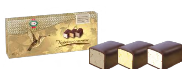
КОНФЕТЫ «КОФЕЙНО-СЛИВОЧНЫЕ» 1/270 CANDIES "CLASSICAL COFFEE AND CREAMY" 1/270 "海滨咖啡奶油味" 糖 "KLASSICHESKIE 咖啡奶油味" 1/270

Упаковка: фрасованная - 1/400, 15 шт в г/к Filled packaging 1/400, 15 pcs in a corrugated box 分包包装: 1/400 · 每个瓦楞纸箱15个