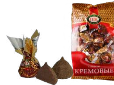
КОНФЕТЫ «ШИКОВЛАДНЫЙ ТРЮФЕЛЬ» В/П CANDIES "SHIKOVFLADNYI TRUFFEL" W/T 夹心糖 "SHIKOVFLADNYI 松露" W/T

Конфеты с шоколадно-кремовым корпусом, обсыпанные смесью какао-порошка и сахарной пудры