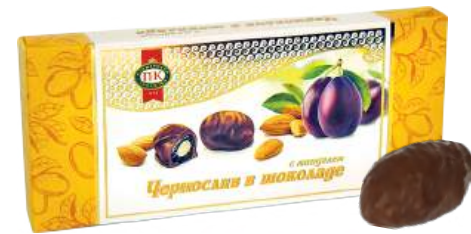
КОНФЕТЫ «ЧЕРНОСЛИВ В ШОКОЛАДЕ» 1/150 CANDIES "PRUNE, COVERED WITH CHOCOLATE" 1/150 夹心糖 "巧克力李子" 1/150

Упаковка: фрасованная - 1/150, 10 шт в г/к Filled packaging 1/150, 10 pcs in a corrugated box 分包包装: 1/150 · 每个瓦楞纸箱10个