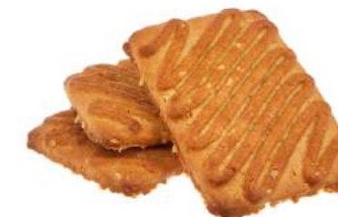
ПЕЧЕНЬЕ «ЗЛАКОВОЕ ОВСЯНОЕ» COOKIES "CEREAL OATMEAL" 饼干 "燕麦片"

Упаковка: весовая - 5 кг в г/к Weight packaging: 5 kg in a corrugated box 重量包装: 每个瓦楞纸箱5公斤