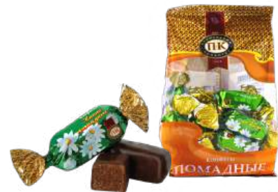
КОНФЕТЫ «КАКАО-ПОМАДНЫЕ» В/П CANDIES "СОСОА FONDANT" W/T 夹心糖 "可可软糖" W/T

Конфеты с помадным сливочным крем-брюле корпусом с добавлением какао-порошка