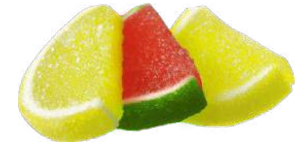
МАРМЕЛАД «АРБУЗНЫЕ И ДЫННЫЕ МАРМЕЛАДКИ» СО ВКУСОМ АРБУЗА И ДЫНИ MARMALADE "WATERMELON AND MELON MARMELADES WITH WATERMELON AND MELON FLAVOUR"

重量包装: 每个瓦楞纸箱8公斤 (每个瓦楞纸箱包括4个 "电视机" 包装·每个重量为2公斤)