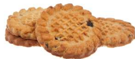
ПЕЧЕНЬЕ «КЛАССИЧЕСКОЕ С ИЗЮМОМ» COOKIES "CLASSICAL WITH RAISIN" 饼干 "经典含带葡萄干"

Упаковка: весовая - 5 кг в г/к Weight packaging: 5 kg in a corrugated box 重量包装: 每个瓦楞纸箱5公斤