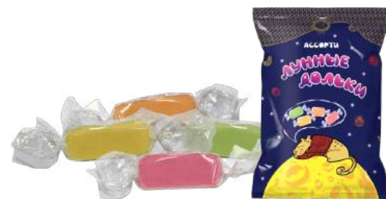
КОНФЕТЫ «ЛУННЫЕ ДОЛЬКИ МИКС» 1/250 SWEETS "MOON SLICES MIKS" 1/250 “月片”(混合)糖果 1/250

Жевательные помадные конфеты со вкусом лайма, банана, апельсина и клубники