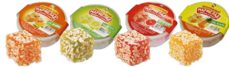
МАРМЕЛАД «С АПЕЛЬСИНОМ» (В КУНЖУТЕ), «С ЛИМОНОМ» (В КУНЖУТЕ), «С ГРЕЙПФРУТОМ» (В КУНЖУТЕ), «С АНАНАСОМ» (В КУНЖУТЕ.) MARMALADE "WITH ORANGE (COVERED WITH SESAME)", "WITH LEMON (COVERED WITH SESAME)", "WITH GRAPEFRUIT" (COVERED WITH SESAME)", "WITH PINEAPPLE (COVERED WITH SESAME)" 水果软糖 什锦橙子(芝麻), 什锦柠檬(芝麻), 什锦葡萄柚(芝麻), 什锦菠萝(芝麻)

Упаковка: фрасованная - 1/400, 12 шт в г/к Filled packaging 1/400, 12 pcs in a corrugated box 分包包装: 1/400 · 每个瓦楞纸箱12个