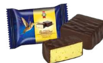
КОНФЕТЫ СБИВНЫЕ «ПРИМОРСКИЕ С ЛИМОННЫМ ВКУСОМ» Т BLOWN WORK "PRIMORSKIE WITH LEMON FLAVOR" S/W 搅制夹心糖 "PRIMORSKIE 有柠檬味" S/W

Упаковка: фрасованная - 1/300, 4 шт в г/к Filled packaging: 1/300, 4 pcs in a corrugated box 分包包装: 1/300 · 每个瓦楞纸箱4个