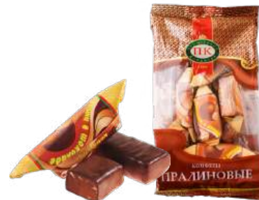
КОНФЕТЫ «ОРЕШКИ В ШОКОЛАДЕ» В/Н CANDIES «NUTS, COVERED WITH CHOCOLATE» S 夹心糖 巧克力坚果 S

Конфеты с пралиновым корпусом с добавлением дроблёного жареного арахиса