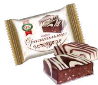
КОНФЕТЫ «ОРИГИНАЛЬНЫЕ» Т CANDIES "ORIGINAL" S/W 夹心糖 "原创" S/W

Купаж сбивной массы с добавлением шоколада и крошки ванильного печенья