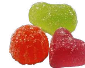
МАРМЕЛАД «ФРУКТОВЫЙ» MARMALADE "FRUITY" 什锦水果

重量包装: 每个瓦楞纸箱8公斤 (每个瓦楞纸箱包括4个 "电视机" 包装·每个重量为2公斤)