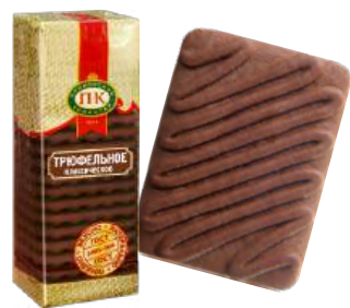
ПЕЧЕНЬЕ «ТРЮФЕЛЬНОЕ КЛАССИЧЕСКОЕ» COOKIES "TRUFFLE CLASSICAL" 饼干 "松露经典"

Сахарное печенье с добавлением какао-порошка и яичного желтка Sugar cookies with cocoa powder and egg yolk 含可可粉和蛋黄的糖饼干